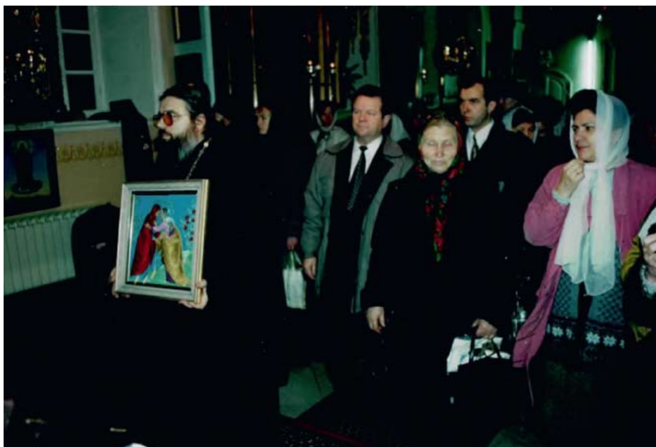
Передача иконы в дар монастырю