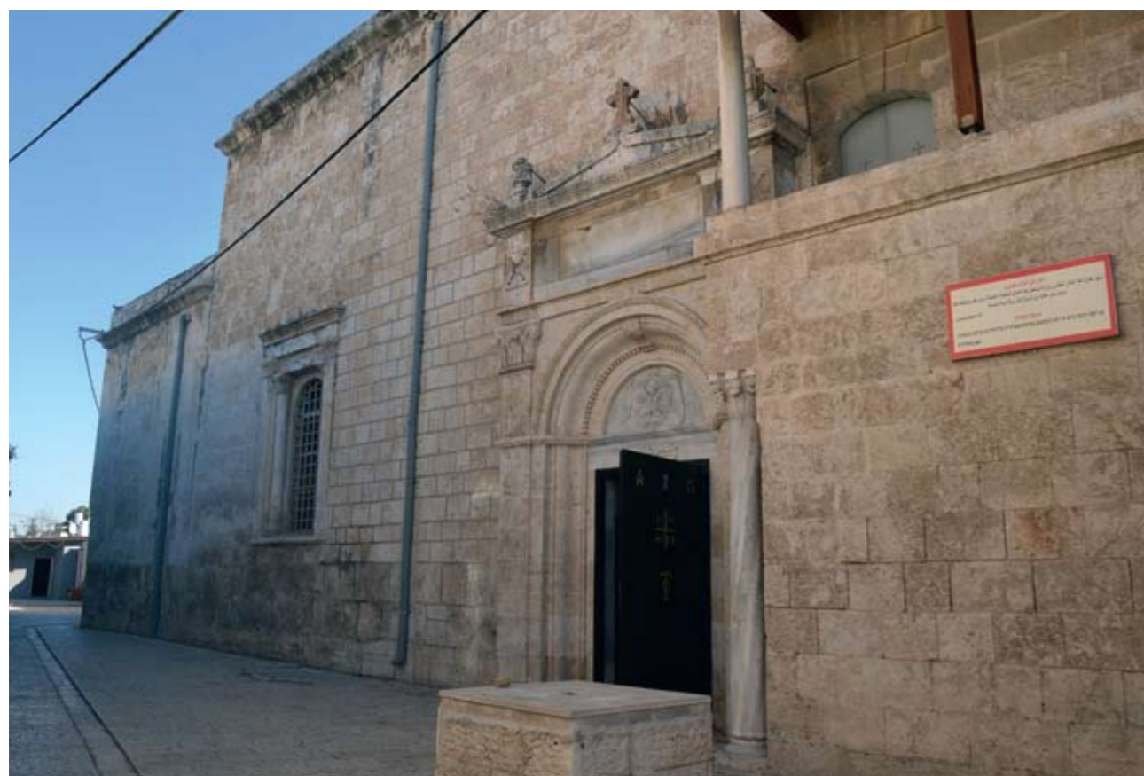
Лидда. Храм св. великомученика Георгия Победоносца