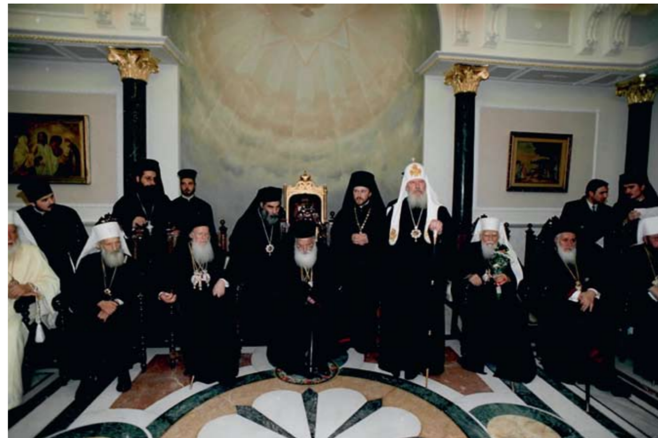
Вифлеем. Предстоятели Православных Церквей