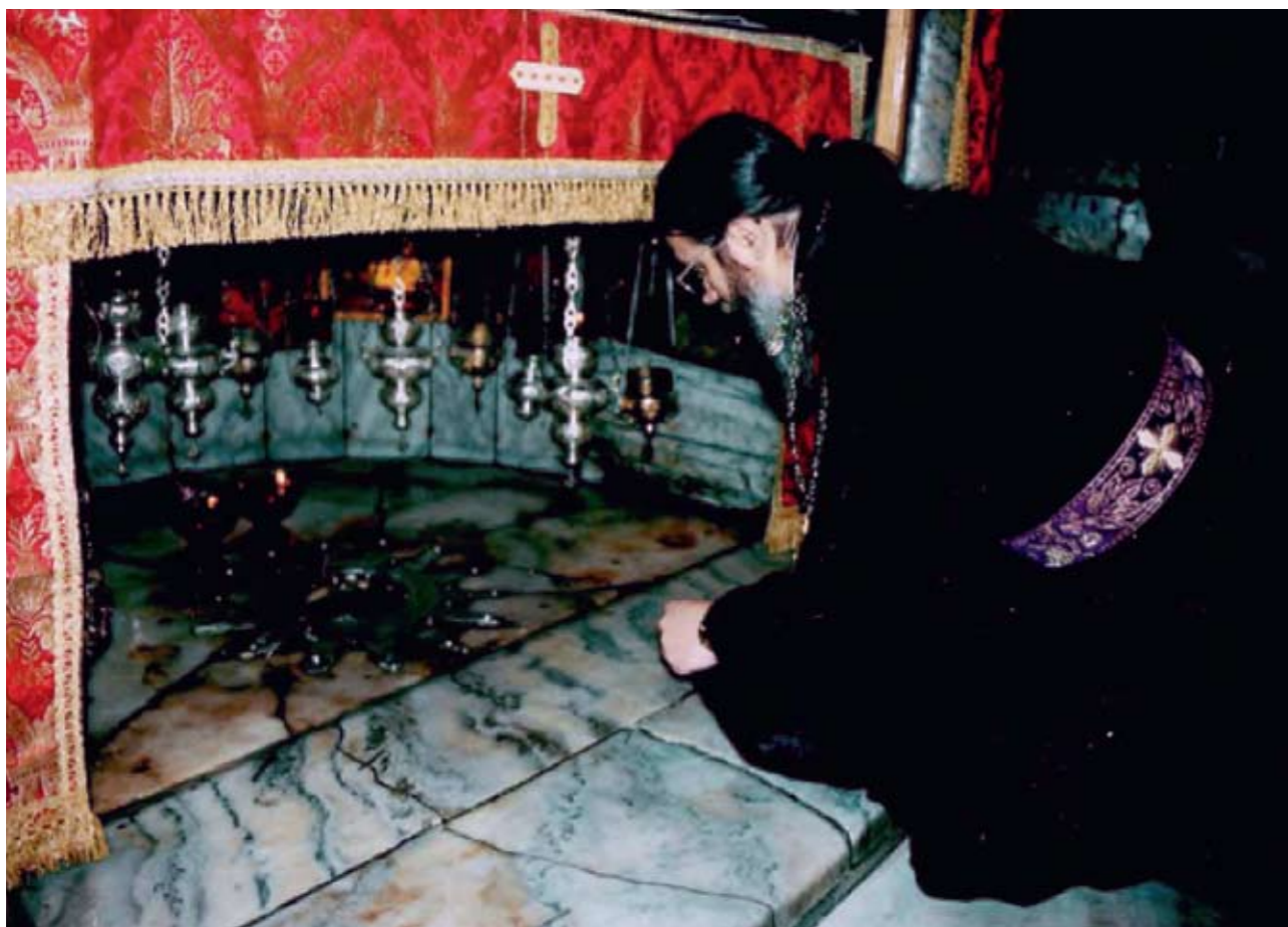
Поклонение месту Рождества Христова