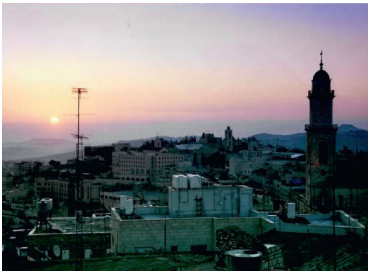
Вифлеем. После ночного богослужения