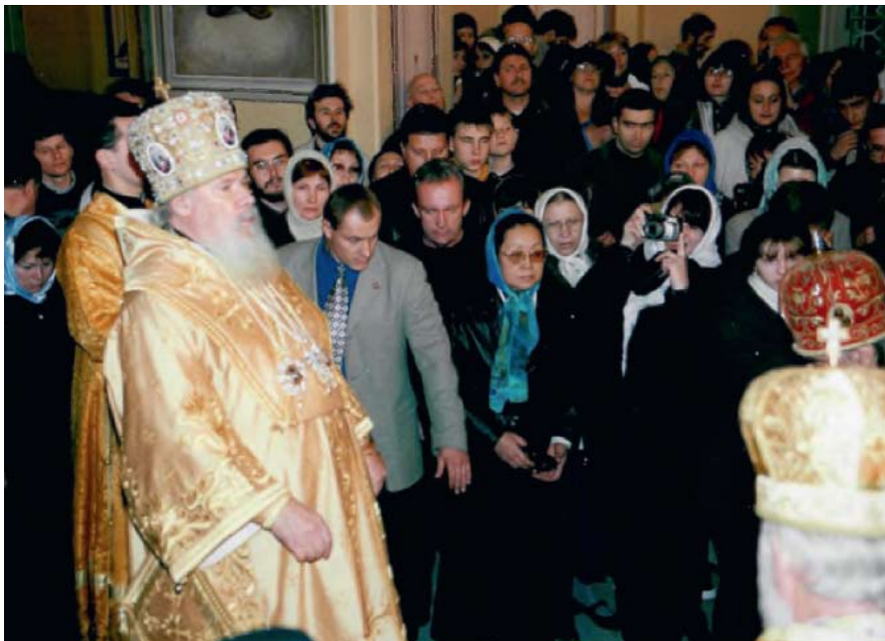
В Троицком соборе Русской Духовной Миссии. 6 января 2000 г.