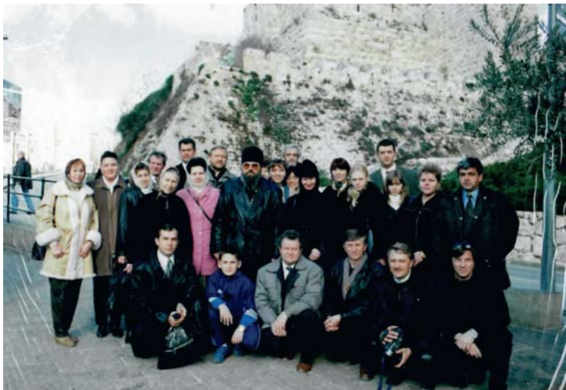
Пензенская паломническая группа