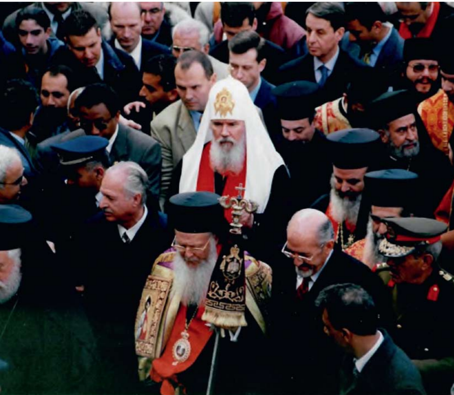
Вифлеем. Встреча Предстоятелей Церквей. Святейший Патриарх Московский и всея Руси Алексий II

2-7 января 2000 года Святейший Патриарх Московский и всея Руси Алексий II во главе официальной делегации Русской Церкви находился в Святой Земле с паломническим визитом, приуроченным к всеправославному празднованию 2000-летия Рождества Христова.