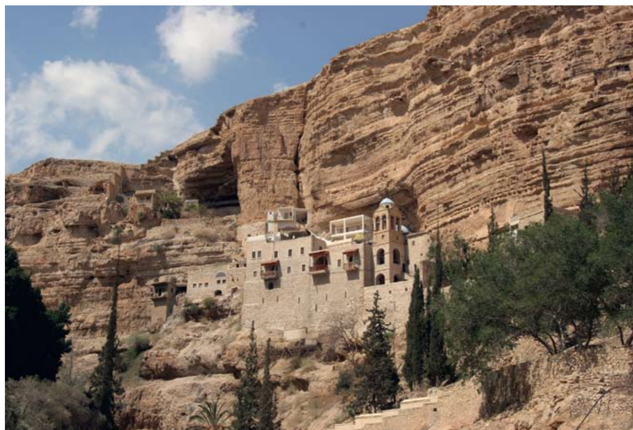
Монастырь Георгия Хозевита