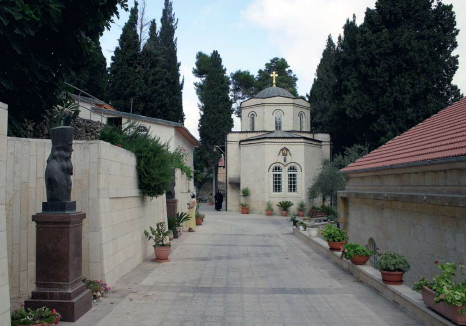
Горненский монастырь. Храм Казанской иконы Божией Матери