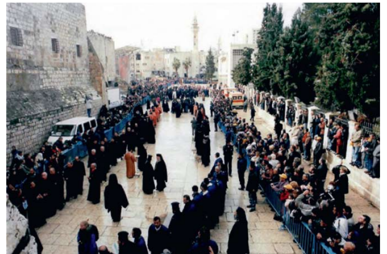
Вифлеем. Встреча Предстоятелей Церквей