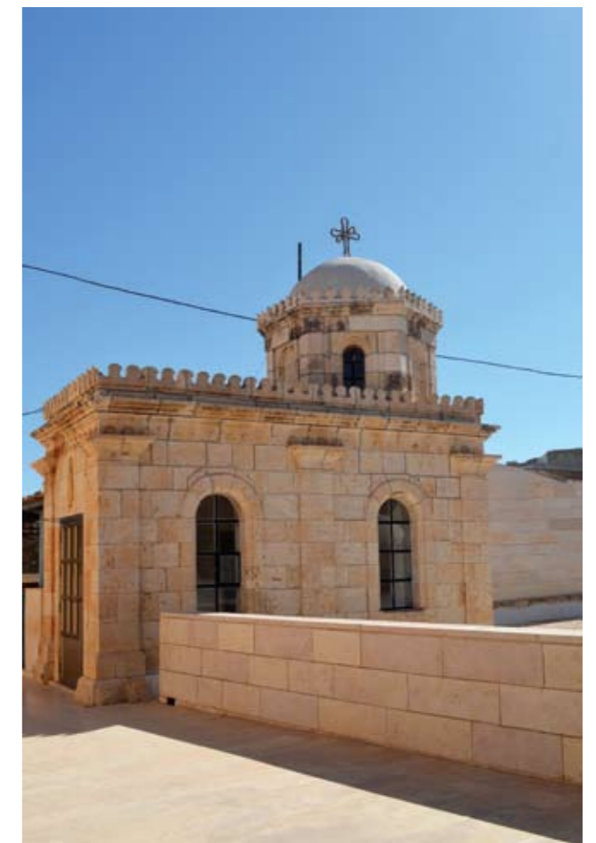
Монастырь Феодосия Великого. Часовня над Пещерой трёх волхвов