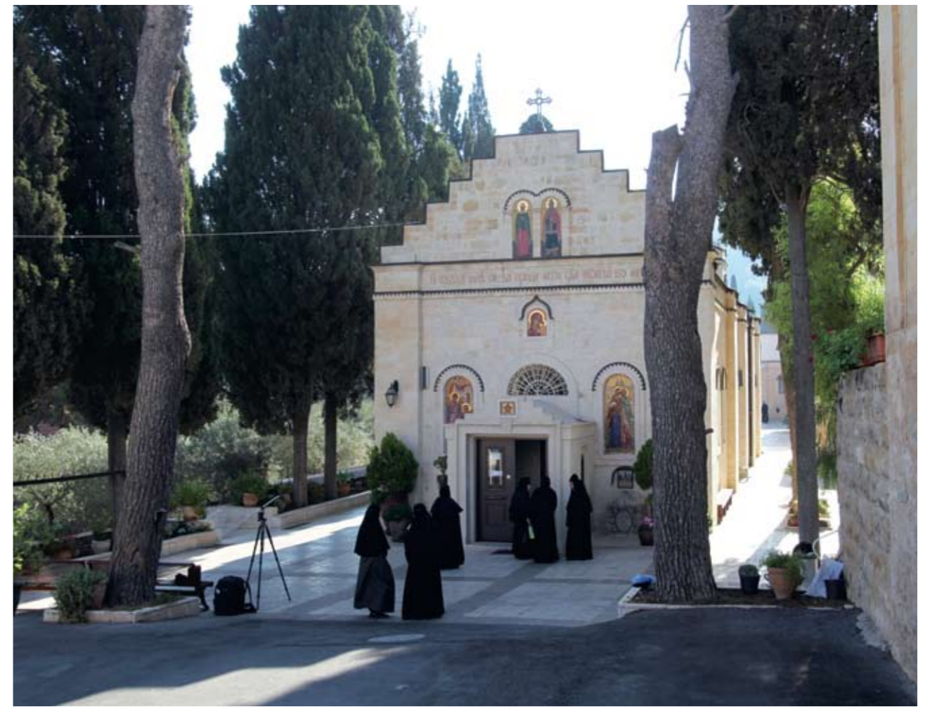
Горненский монастырь. Храм Казанской иконы Божией Матери