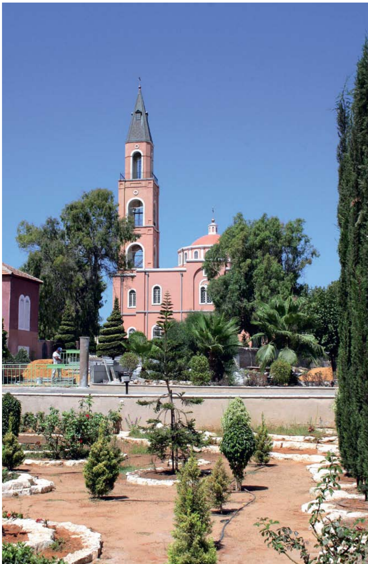
Яффа. Храм в честь праздника Поклонения честным веригам апостола Петра