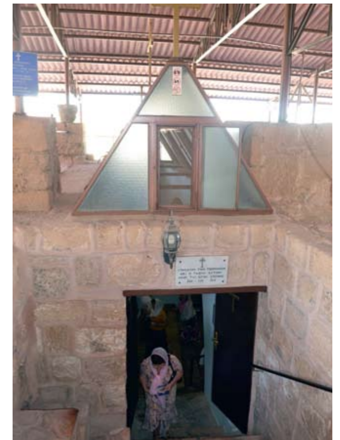
Пещерный храм Георгия Победоносца над могилой пастушков