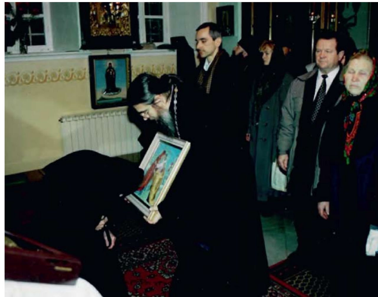
Передача иконы в дар монастырю