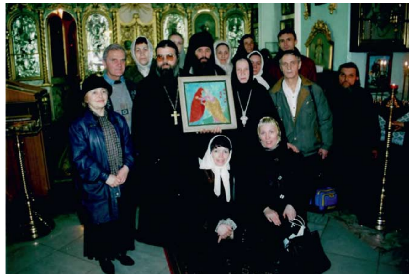
Пензенские паломники в Готрненском монастыре