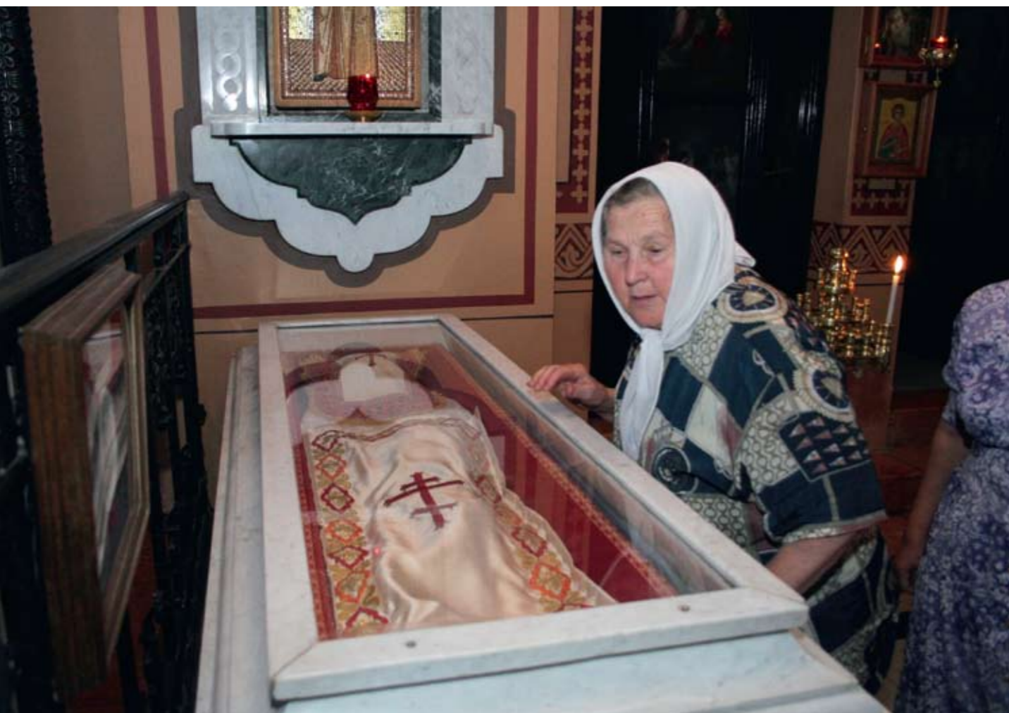
Храм Марии Магдалины. Мощи св. преподобномученицы Елисаветы Феодоровны