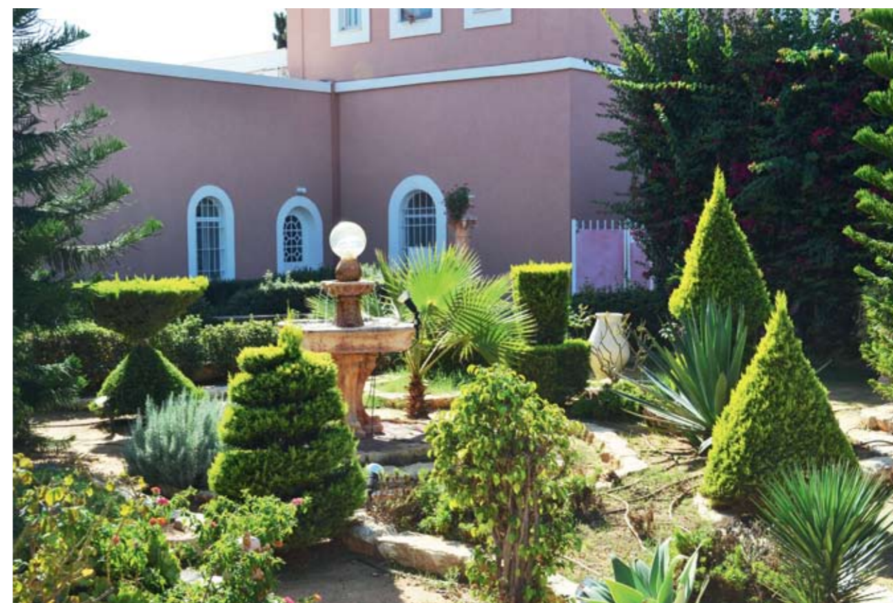
Яффа. Территория храма св. апостола Петра