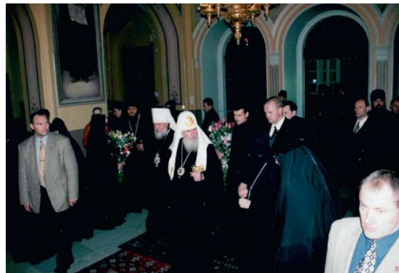
В Троицком соборе Русской Духовной Миссии. 6 января 2000 г.