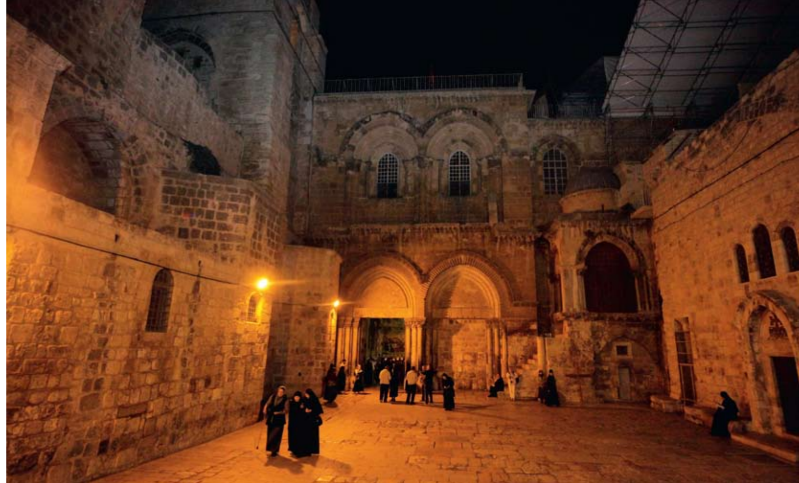
Вход в храм Гроба Господня