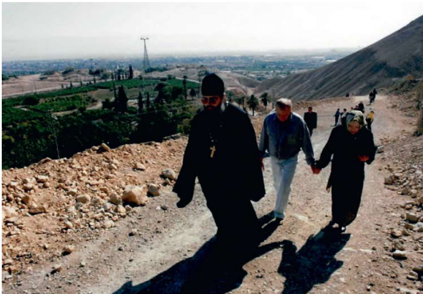
Подъём на Сорокадневную гору