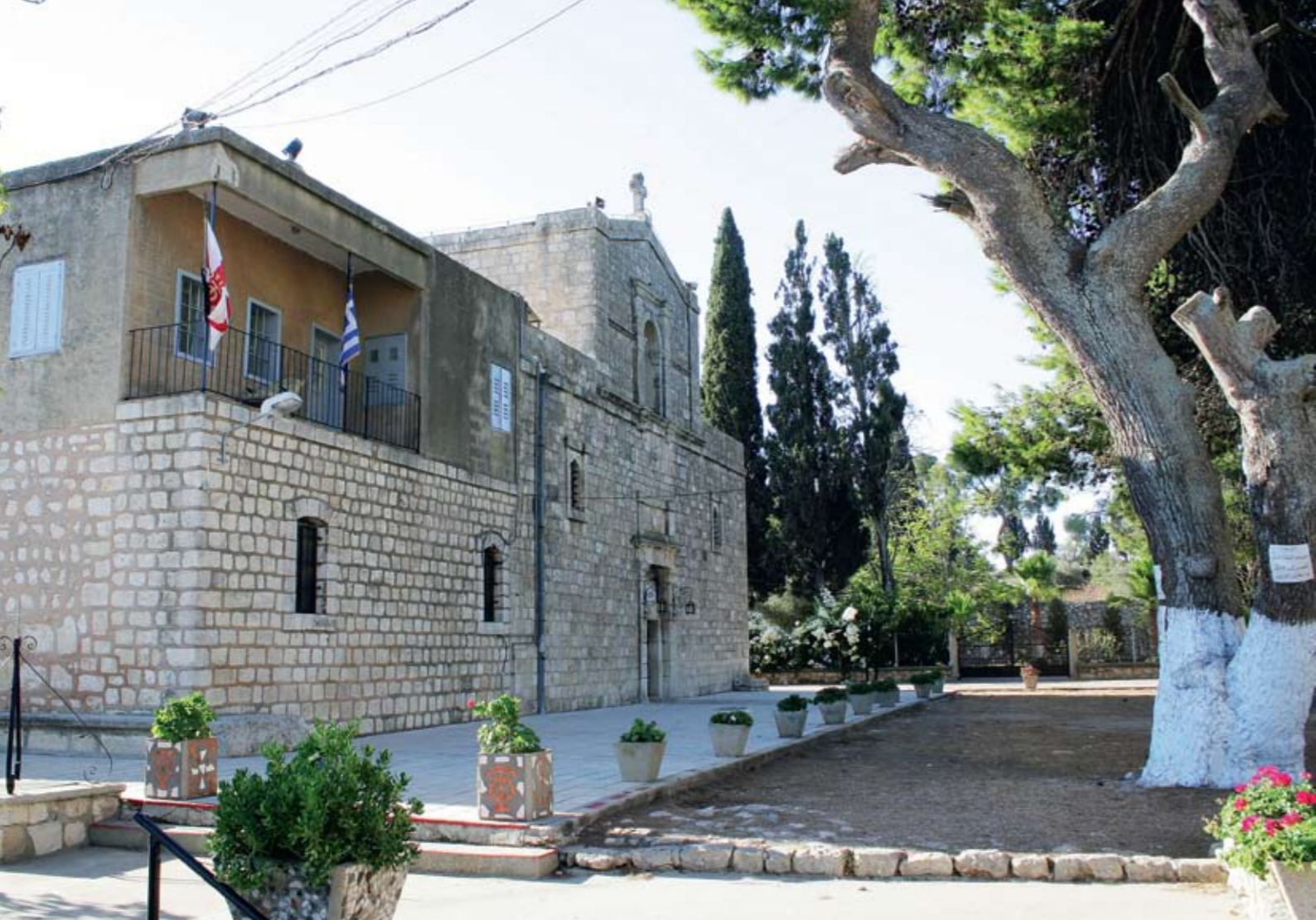
Храм Преображения Господня на горе Фавор