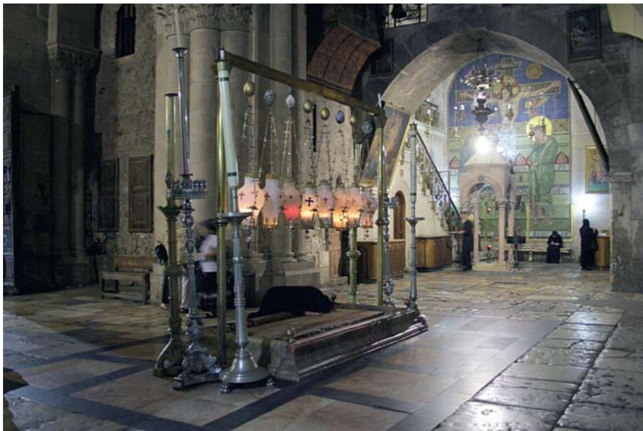
Камень Помазания в храме Гроба Господня