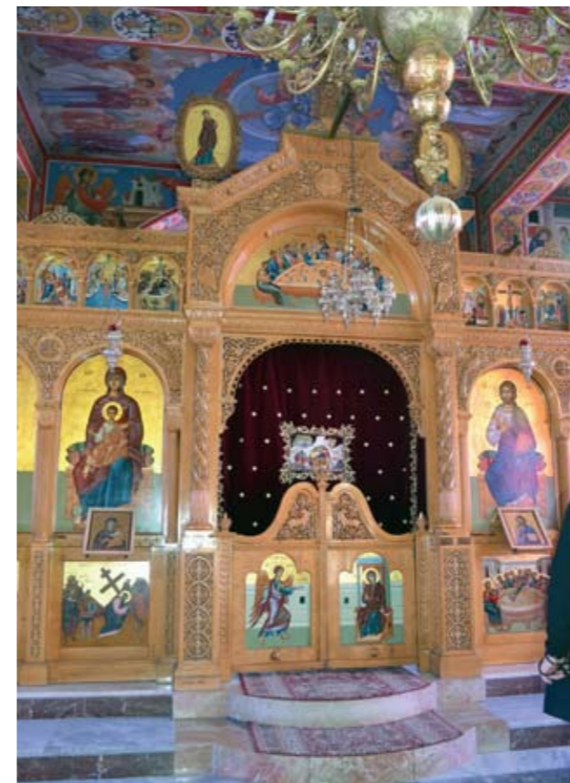
Иконостас храма Собора Пресвятой Богородицы