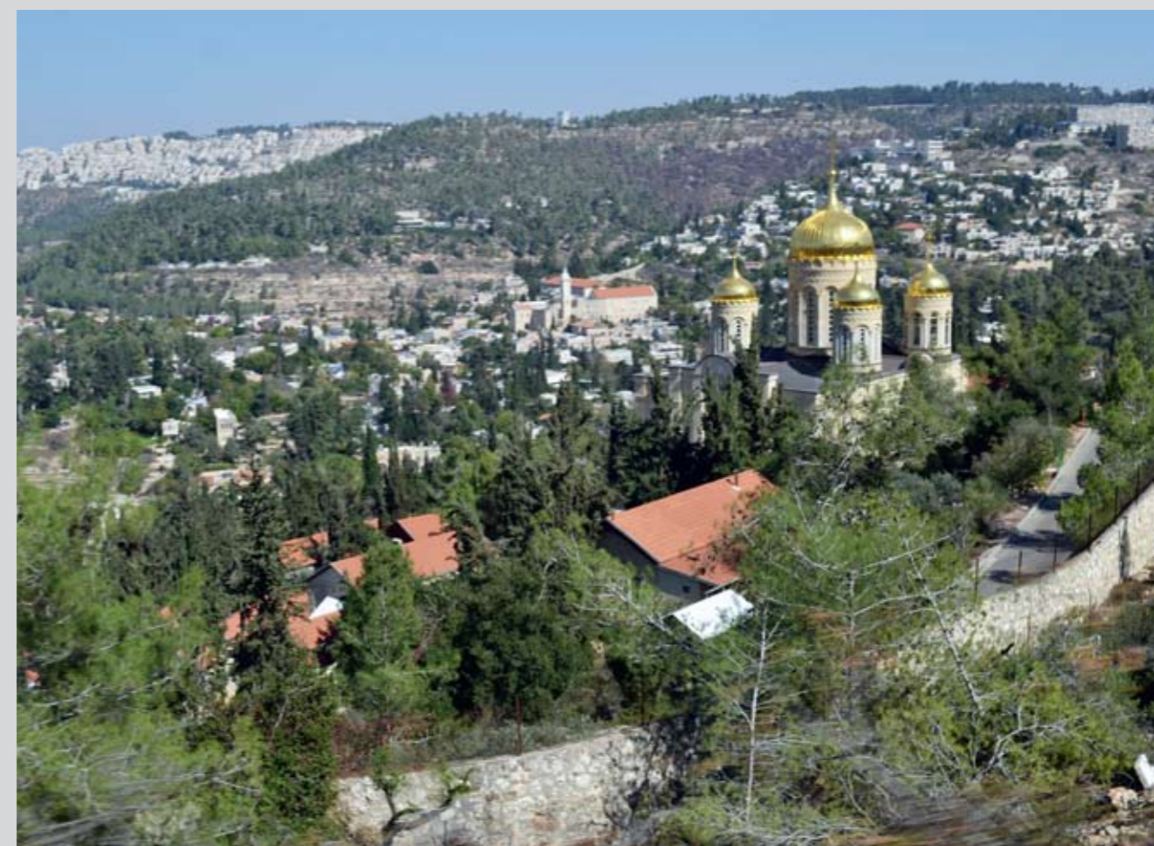
Иерусалим. Горненский (Горний) женский монастырь. Храм во имя Всех святых, в земле Российской просиявших

3–30 – Возвращение в гостиницу. Отдых. 10–00 – Завтрак. Свободная программа. 12–30 – Обед. 13–00 – Выезд в Горний монастырь. Осмотр монастыря. 15–00 – Праздничное богослужение в монастыре. 19–00 – Праздничный приём в гостинице «Вифлеем».