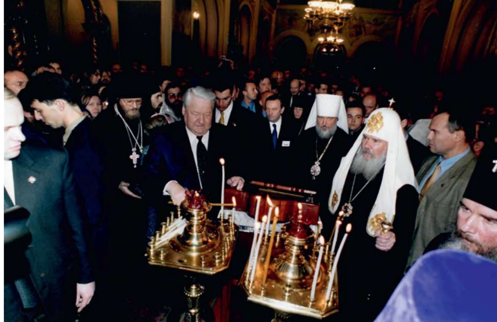
В Троицком соборе Русской Духовной Миссии. 6 января 2000 г.