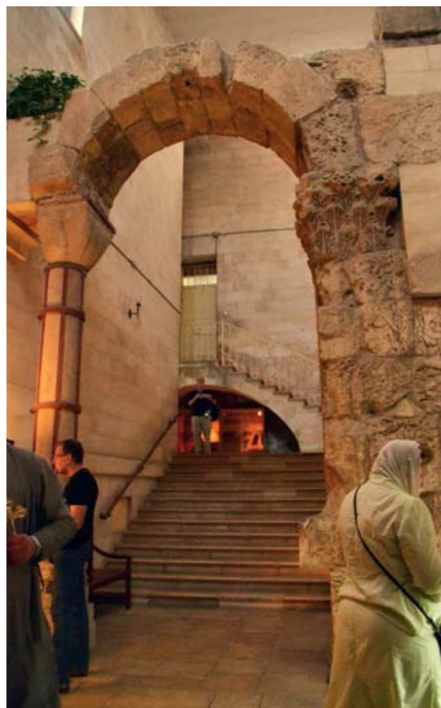
Арка базилики Воскресения Господня