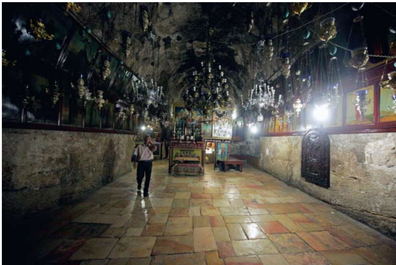
В храме Успения Божией Матери