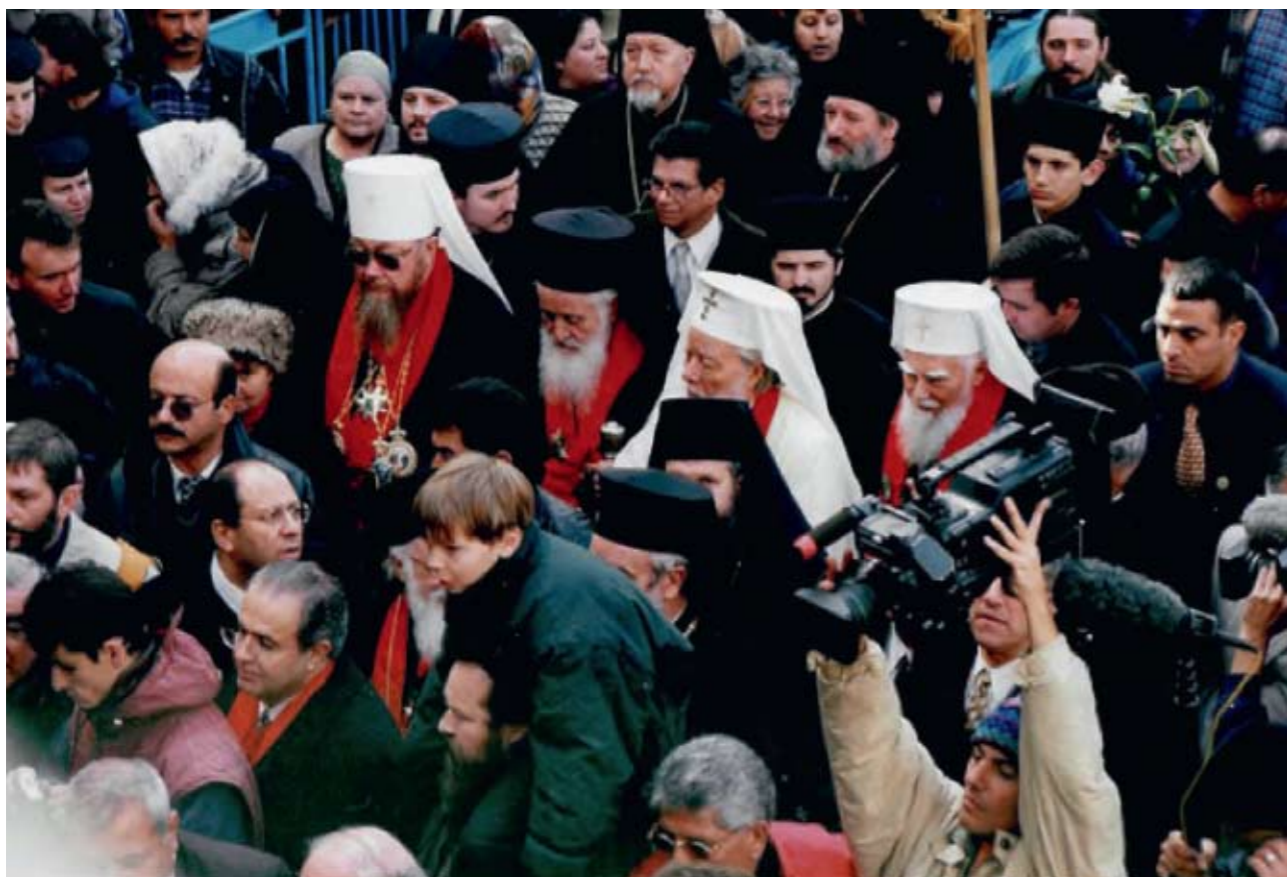
Вифлеем. Встреча Предстоятелей Церквей