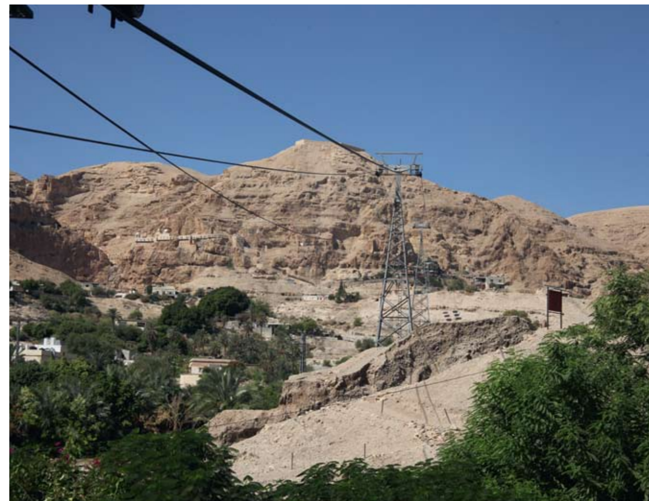
Иерихон. Сорокадневная гора