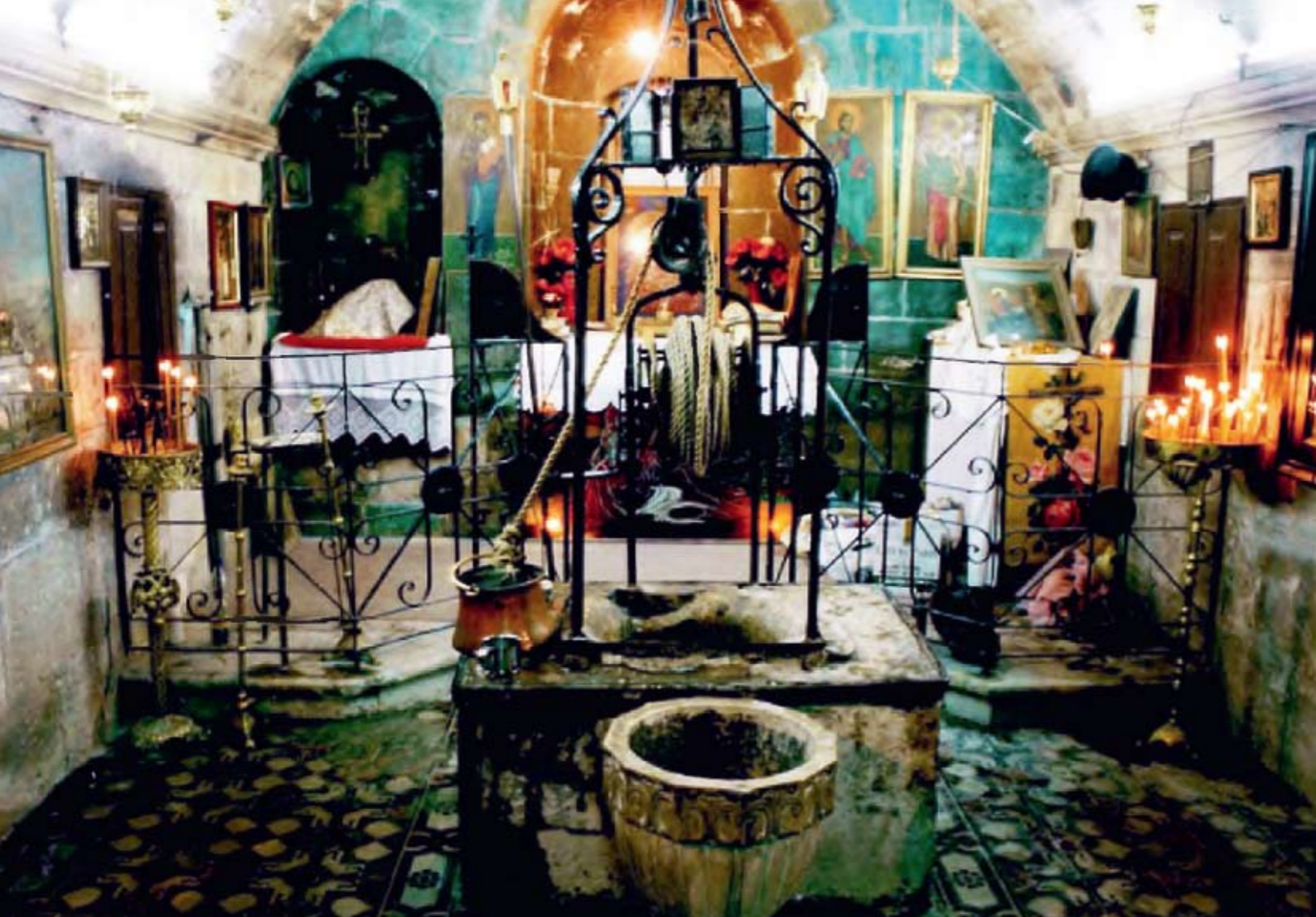
Колодец Иакова в крипте под храмом св. Фотинии Самарянки