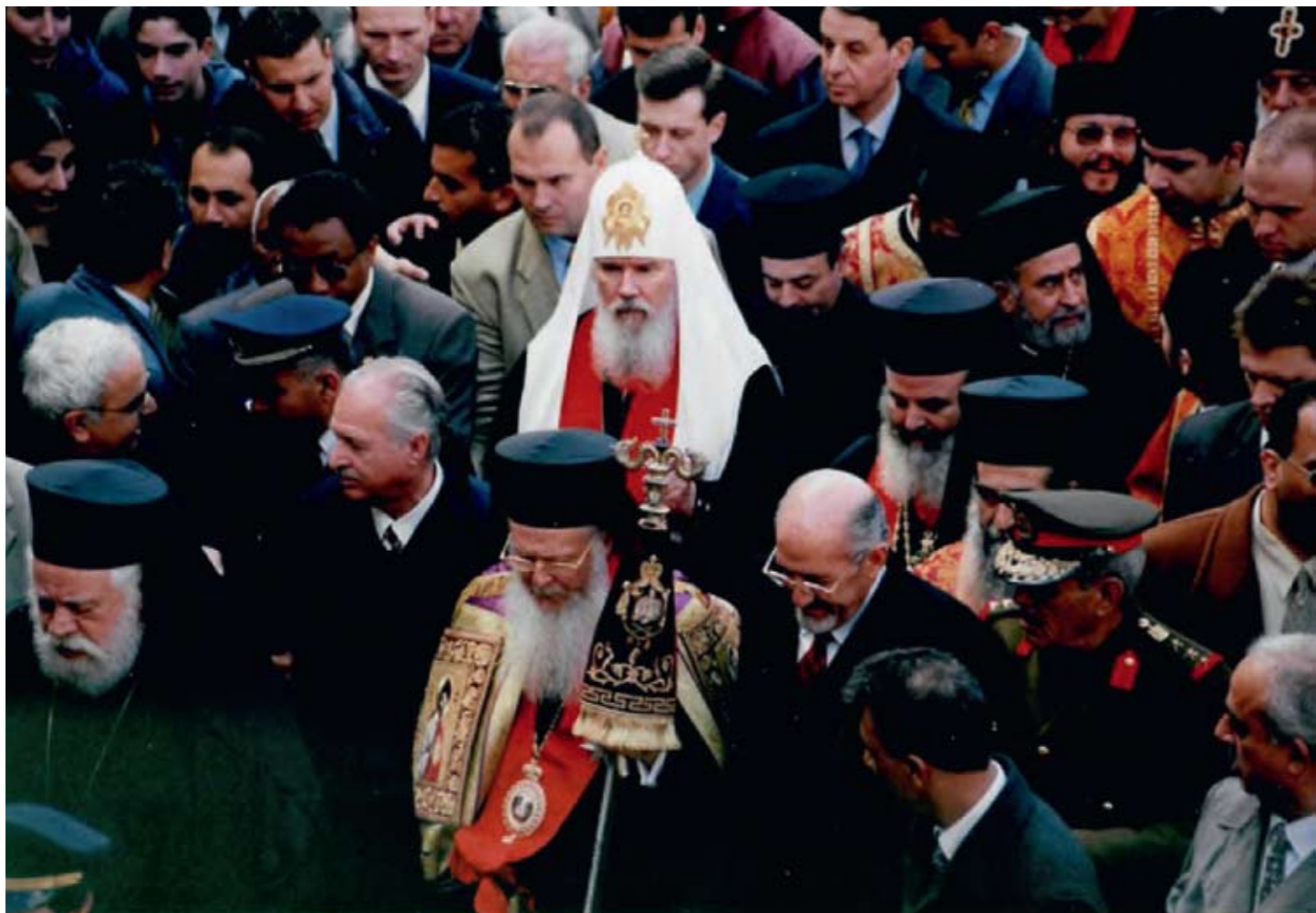
Вифлеем. Встреча Предстоятелей Церквей