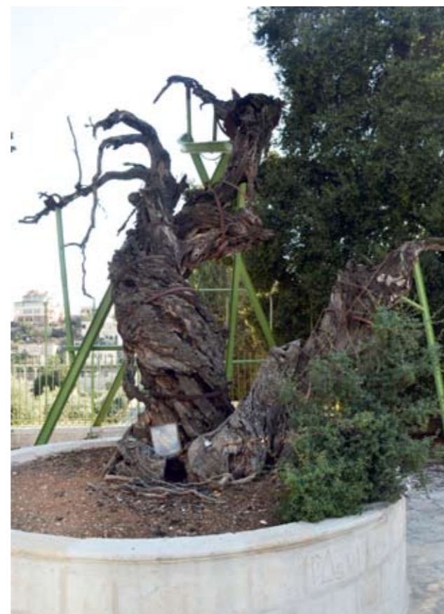
Мамврийский дуб до революции (слева) и в 2014 году (справа)