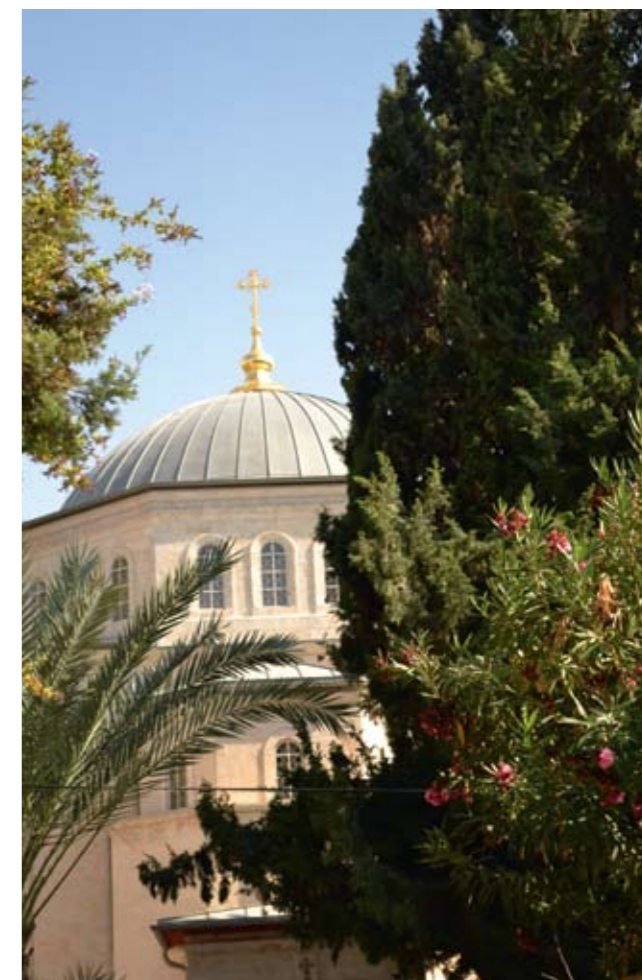
Спасо-Вознесенский собор Елеонского Вознесенского монастыря