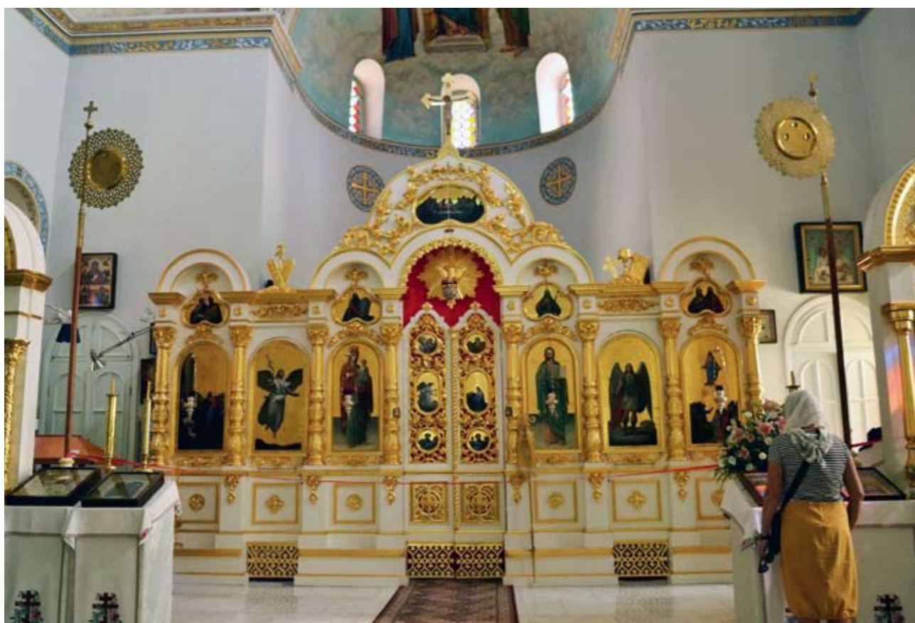
Иконостас Спасо-Вознесенского собора