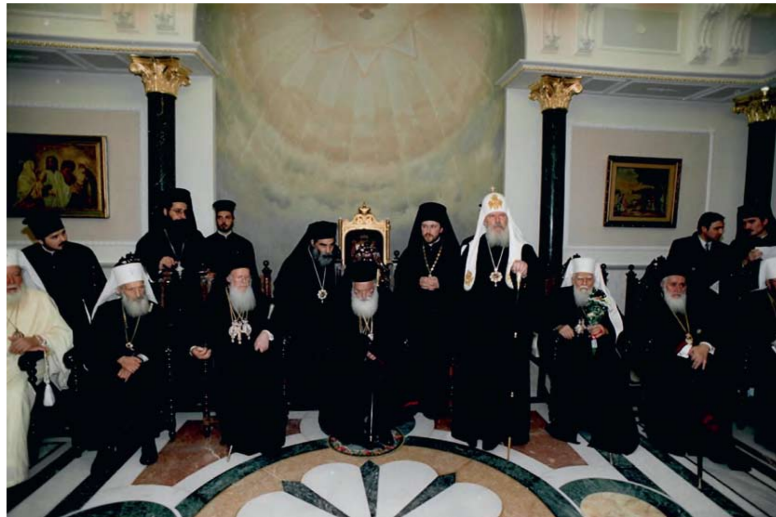
Вифлеем. Предстоятели Православных Церквей

Благодать Господа нашего Иисуса Христа да будет со всеми нами. Аминь.