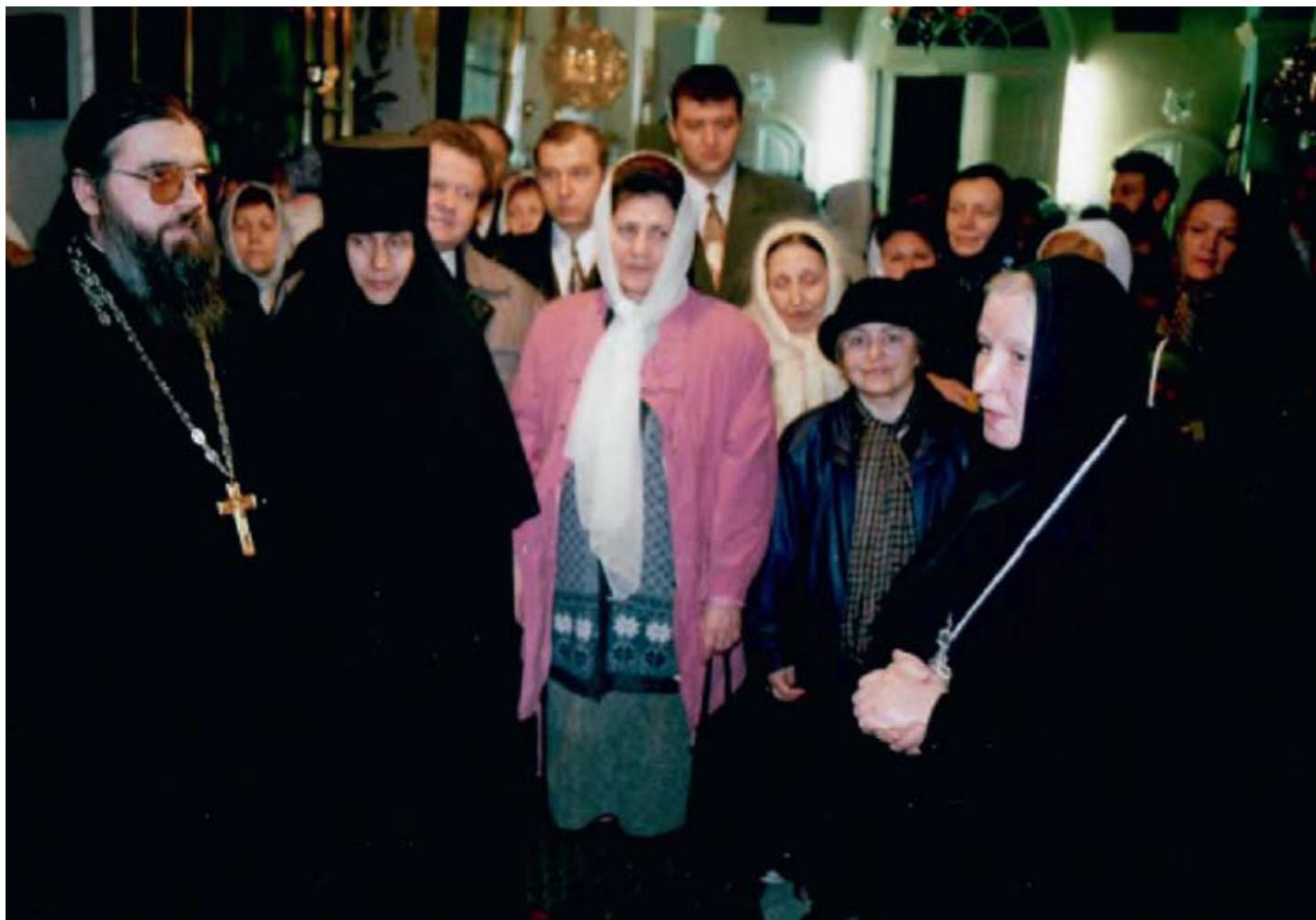
Пензенские паломники в Горненском монастыре