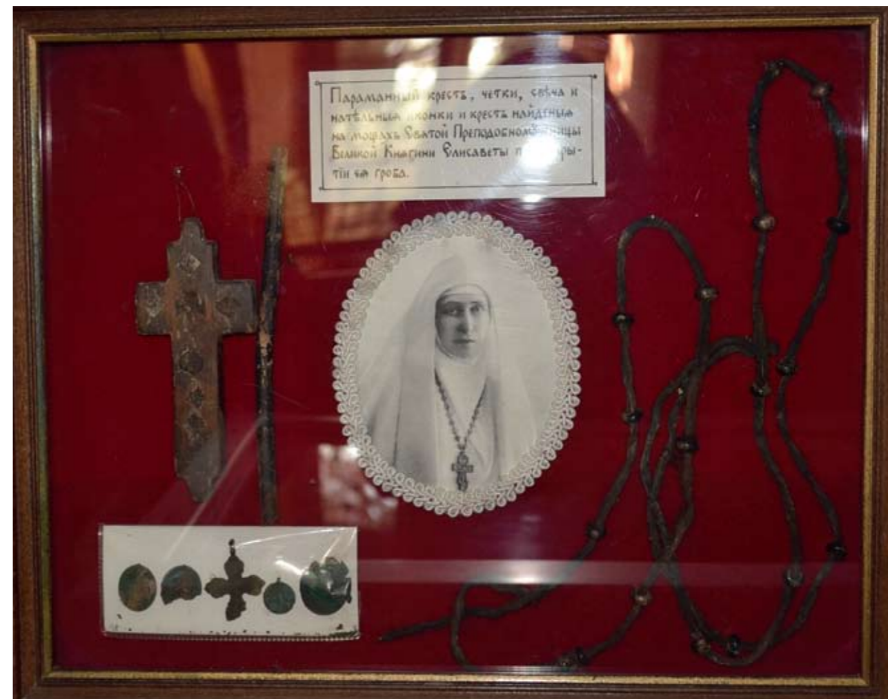
Вещи и мощи св. преподобномученицы Елисаветы Феодоровны