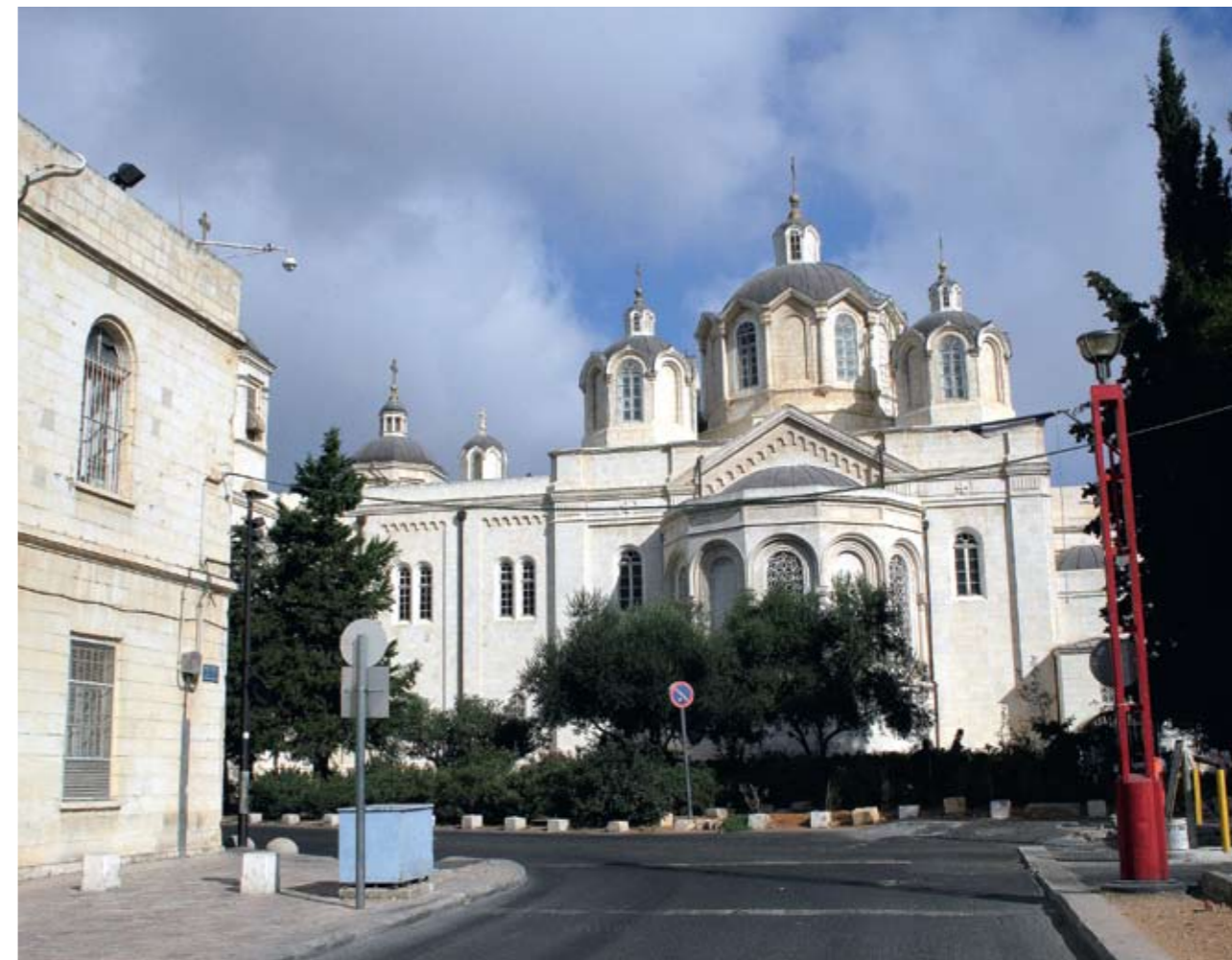
Троицкий собор Русской Духовной Миссии