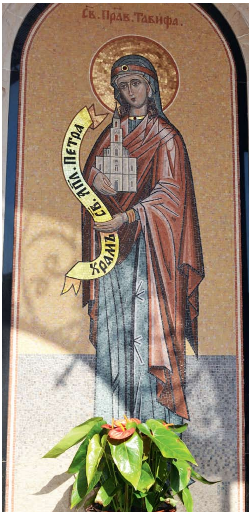
Интерьер храма св. ап. Петра и икона св. праведной Тавифы