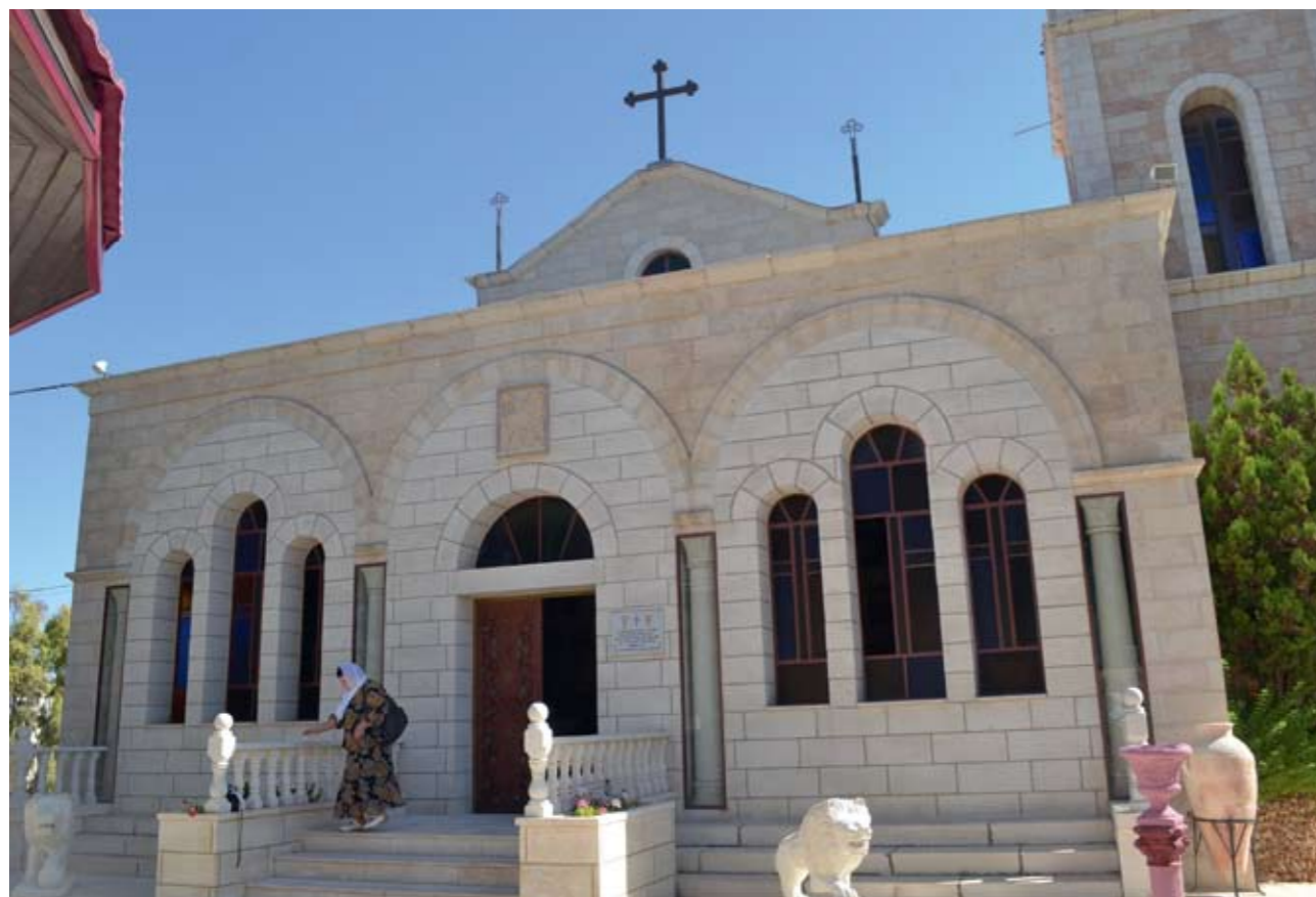
Поле Пастушков. Храм Собора Пресвятой Богородицы