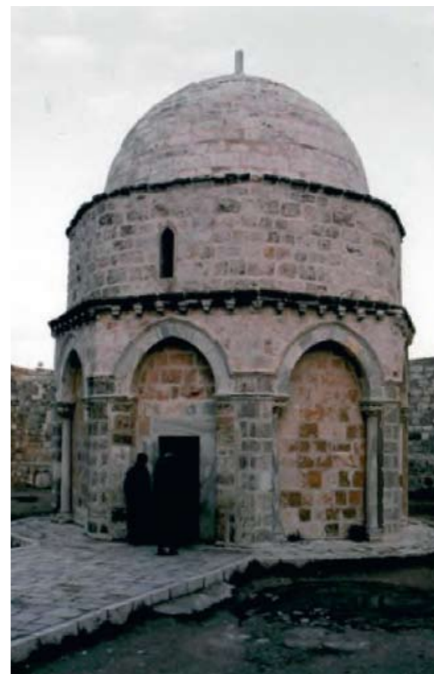
Иерусалим. Елеонская гора. Часовня на месте Вознесения Господня