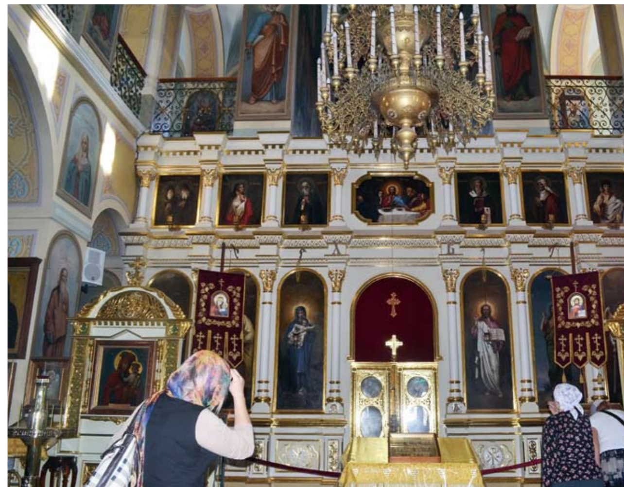
Интерьер храма св. ап. Петра и икона св. праведной Тавифы