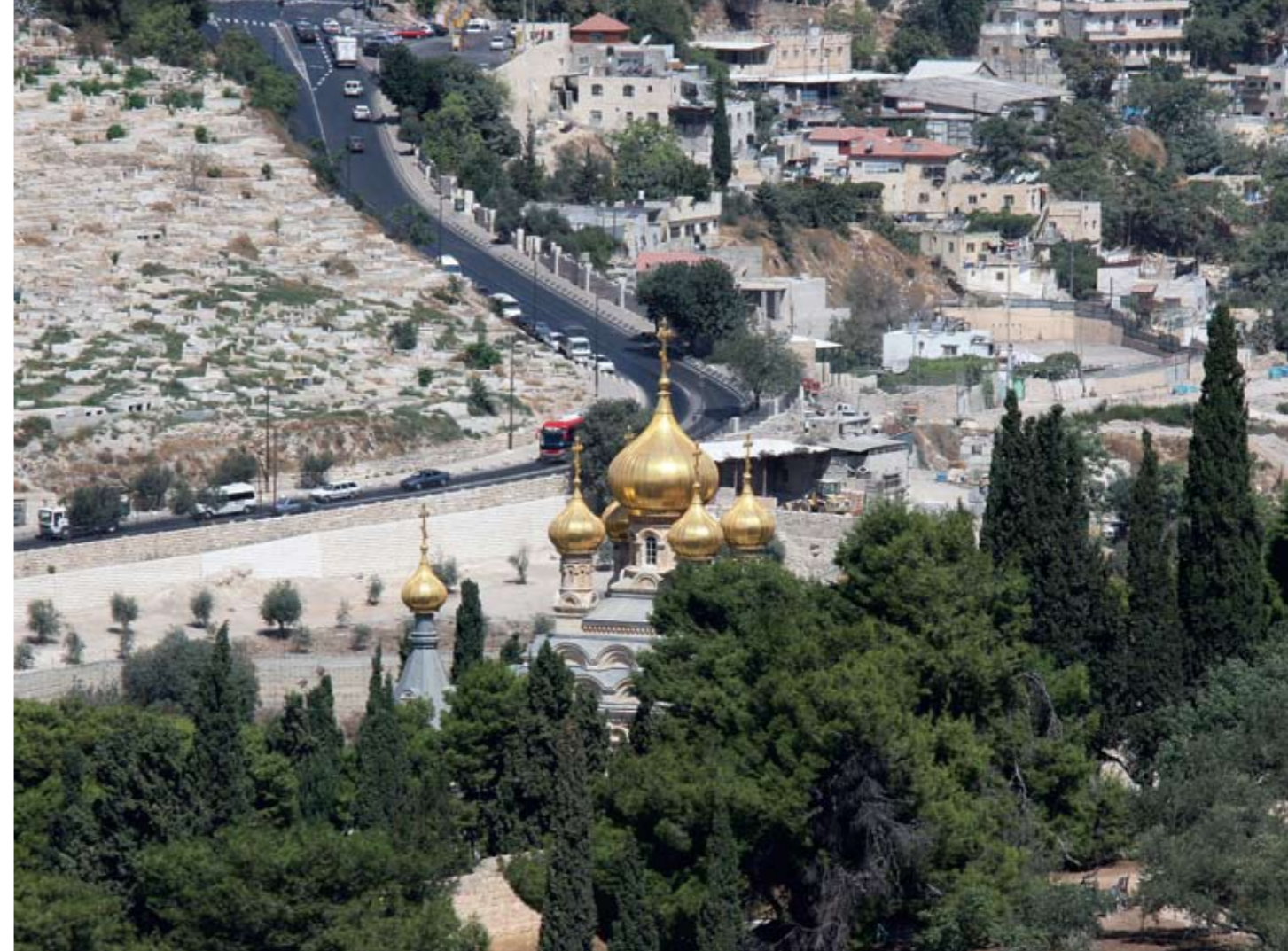
Гетсимания. Храм Марии Магдалины