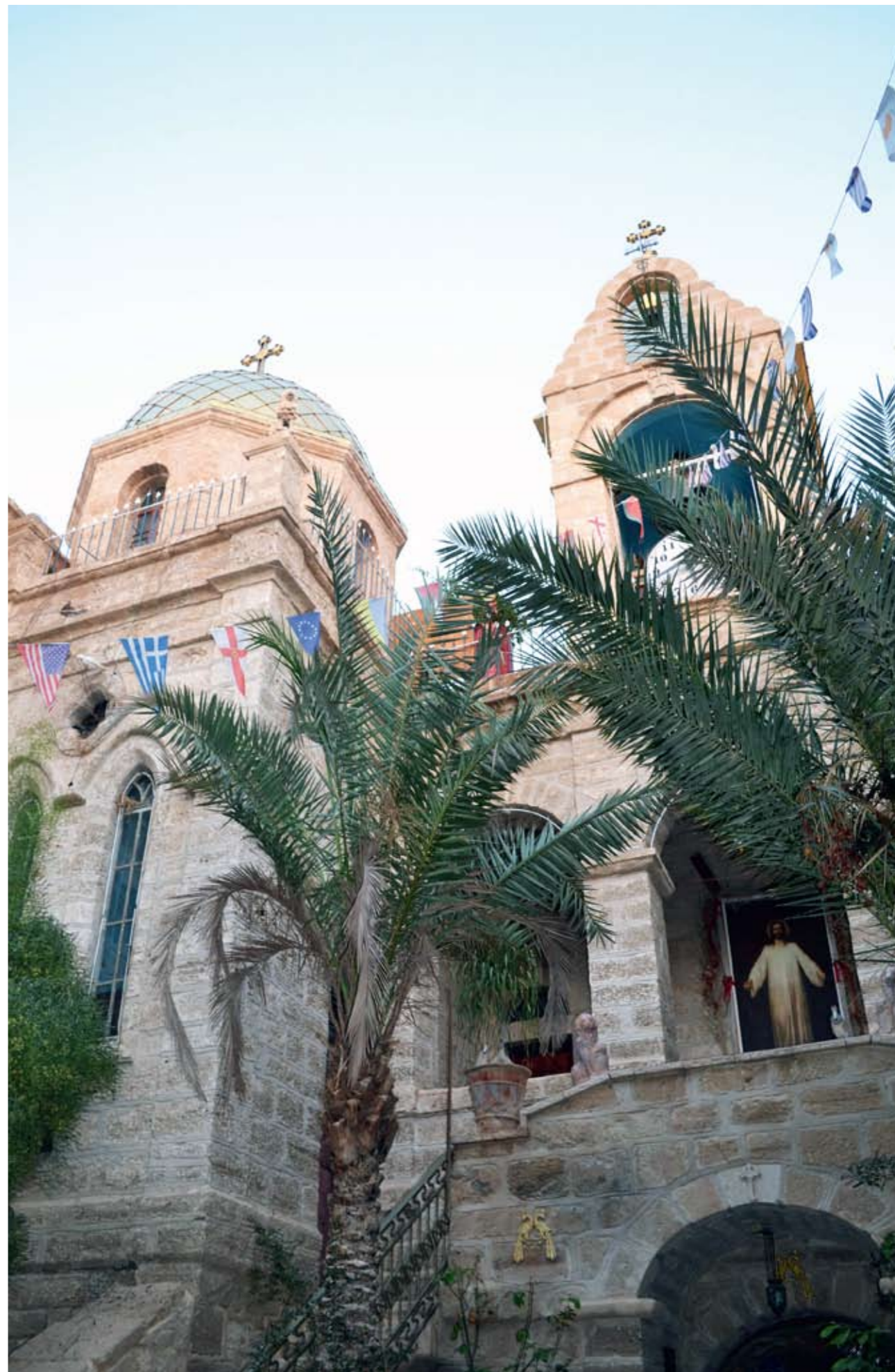
Монастырь преподобного Герасима Иорданского