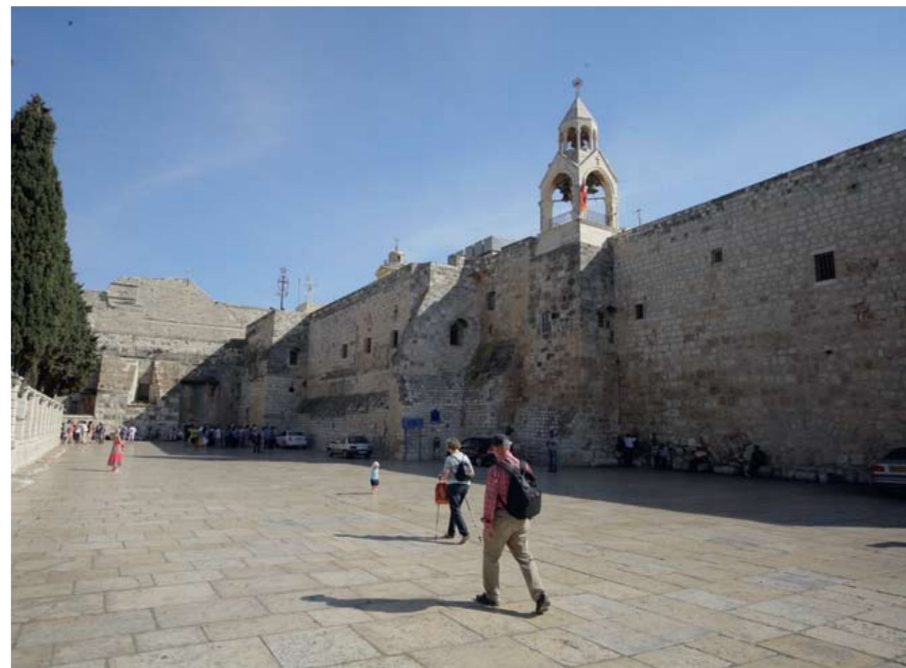
Вифлеем. Храм Рождества Христова