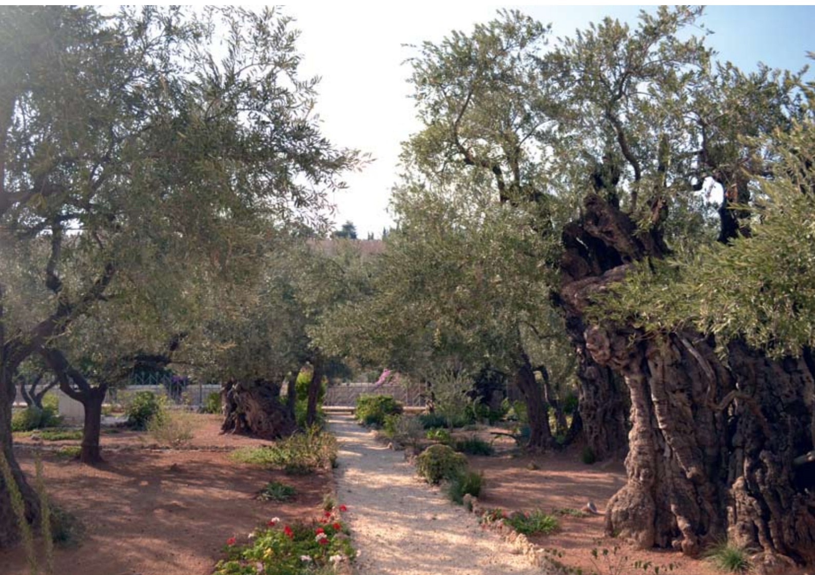
Гетсиманский сад. Старинные оливы