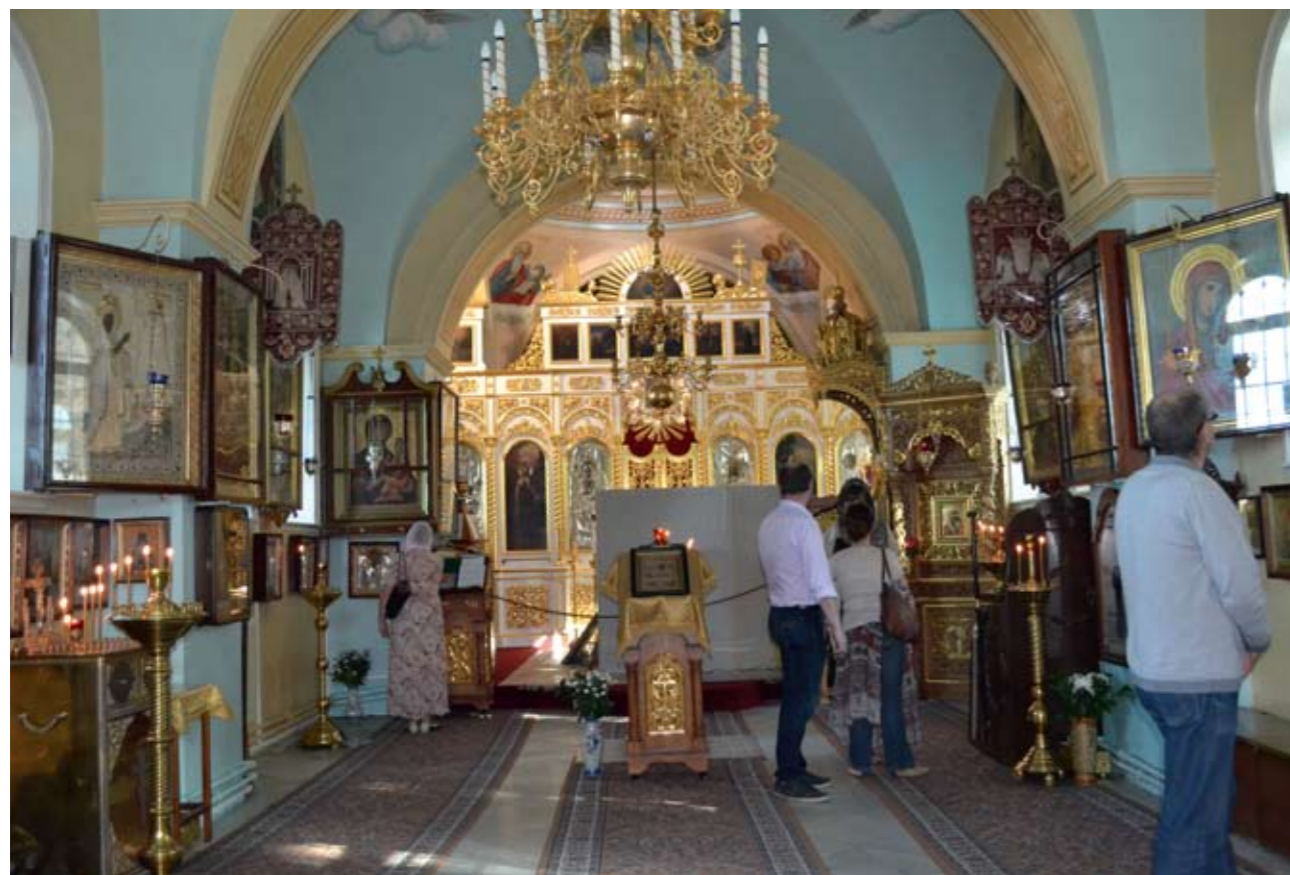
Интерьер Казанской церкви