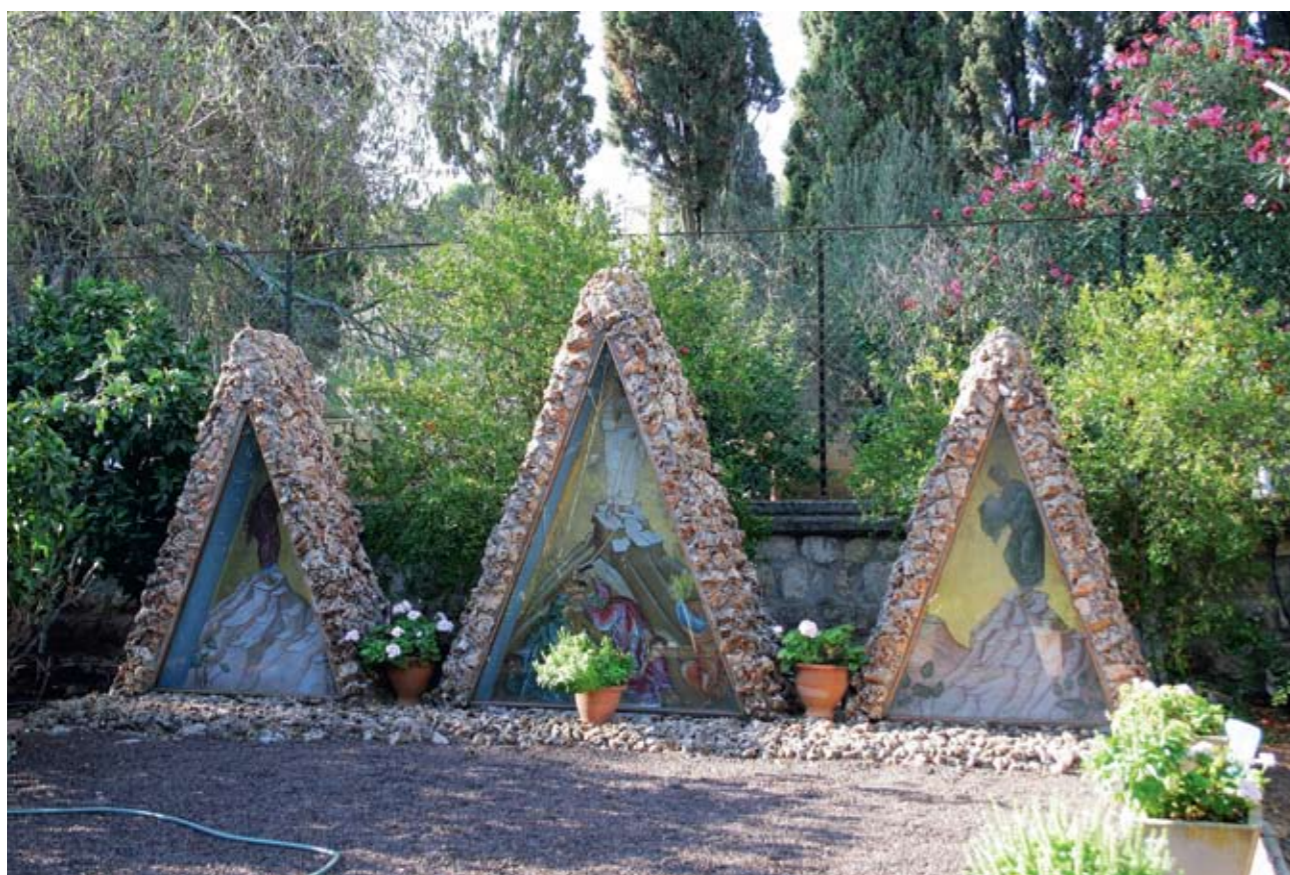
Три кущи на горе Фавор