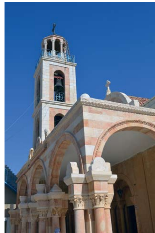
Монастырь Феодосия Великого. Благовещенская церковь