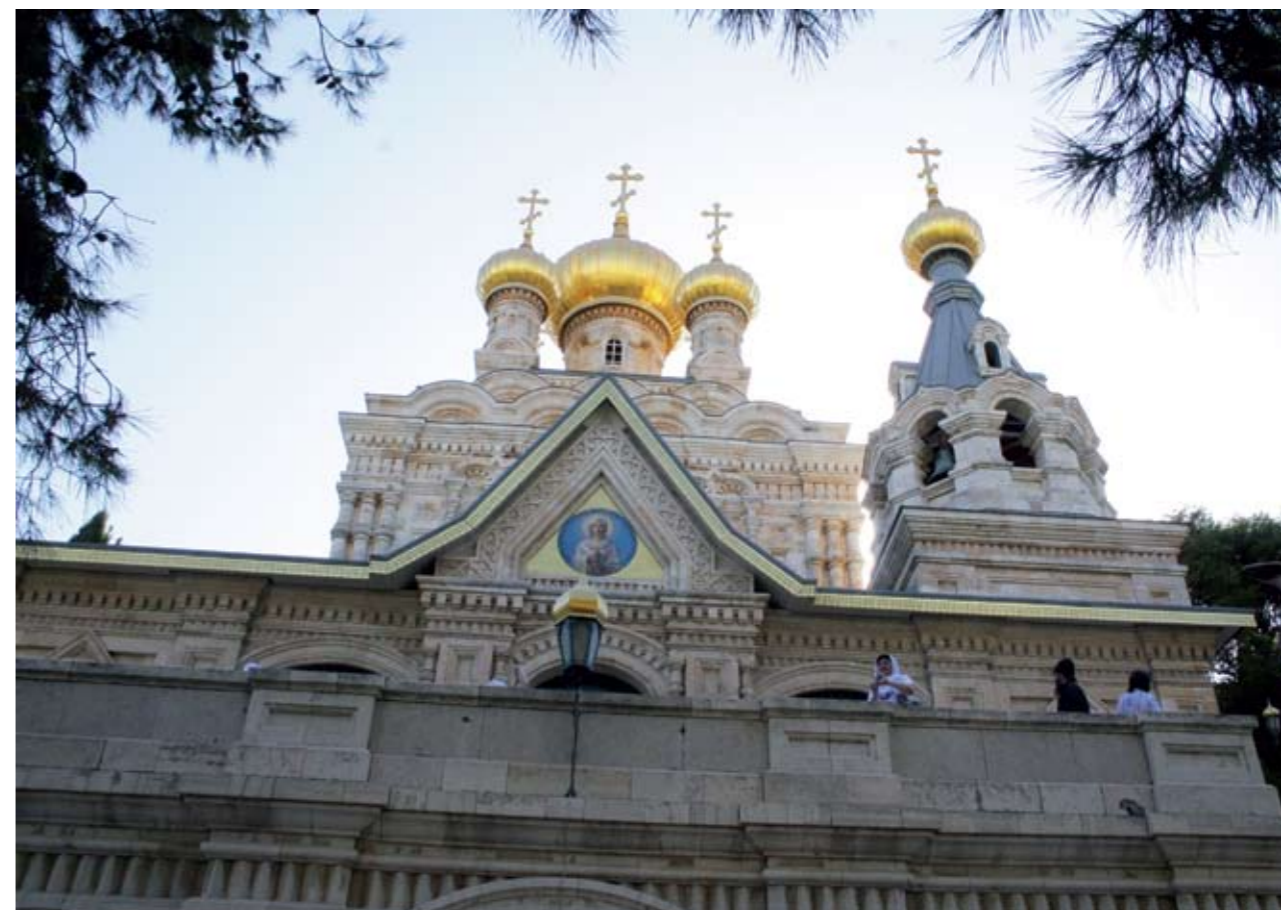
Гетсимания. Храм Марии Магдалины