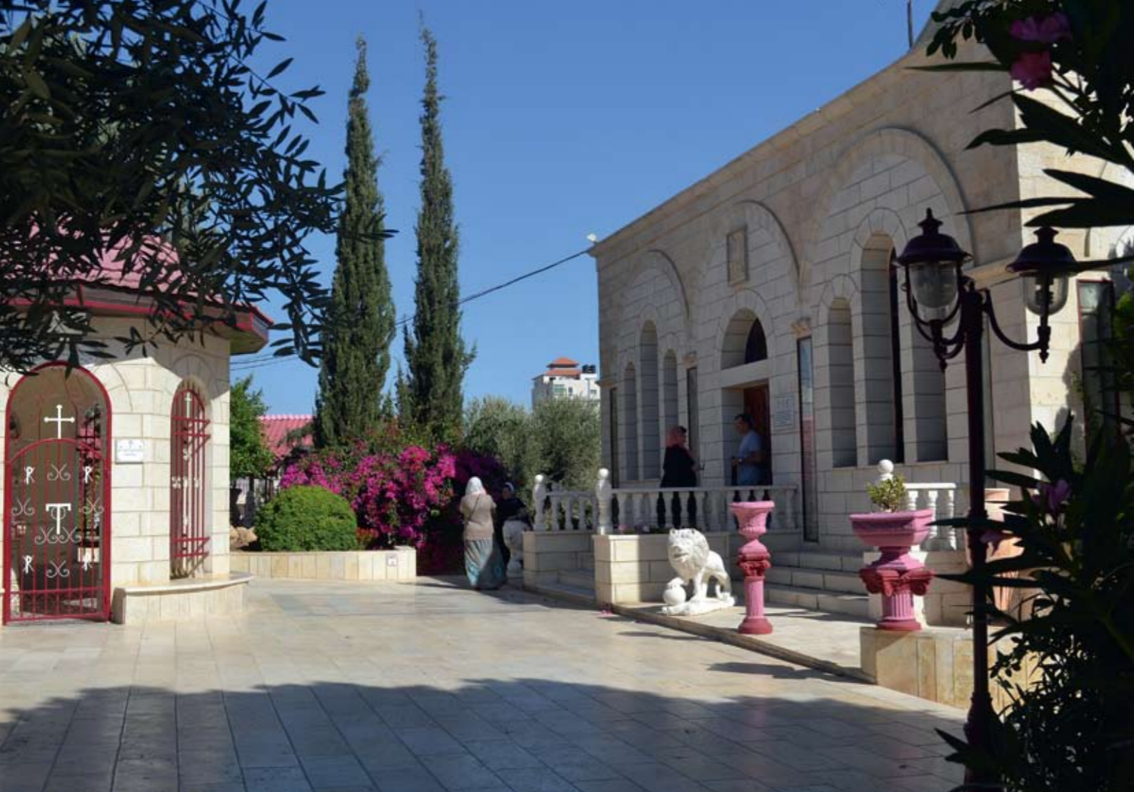
Поле Пастушков. Храм Собора Пресвятой Богородицы