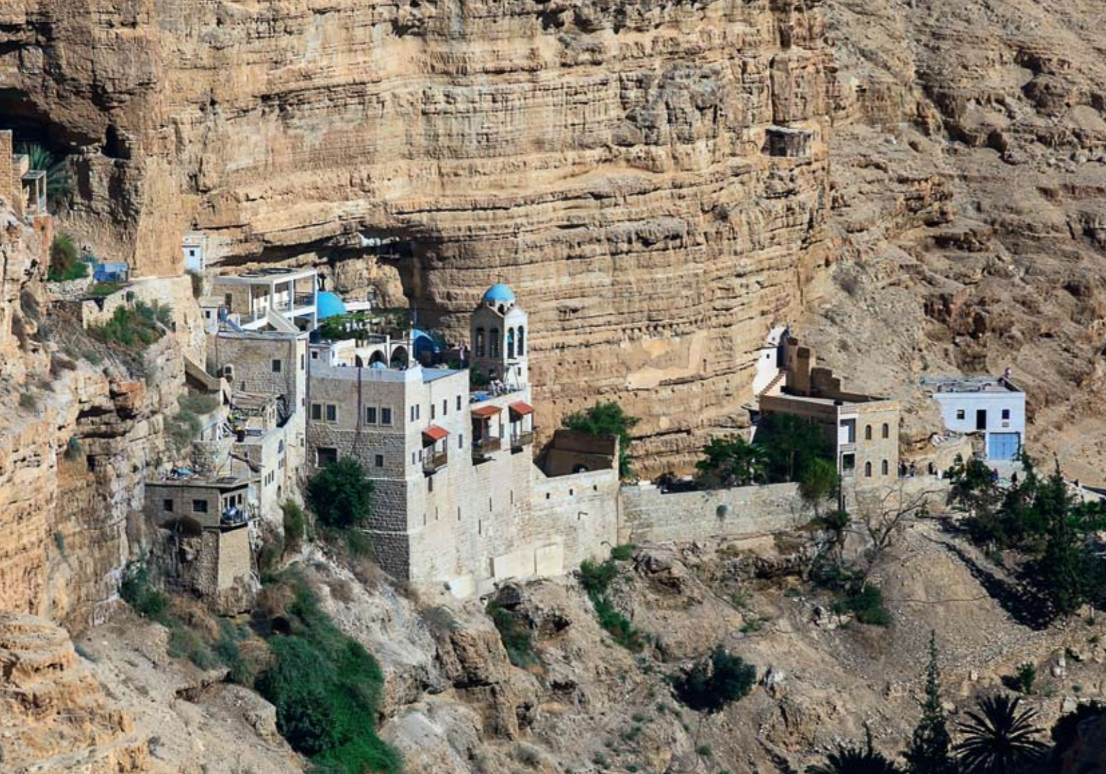
Ущелье Вади Кельт. Монастырь Георгия Хозевита