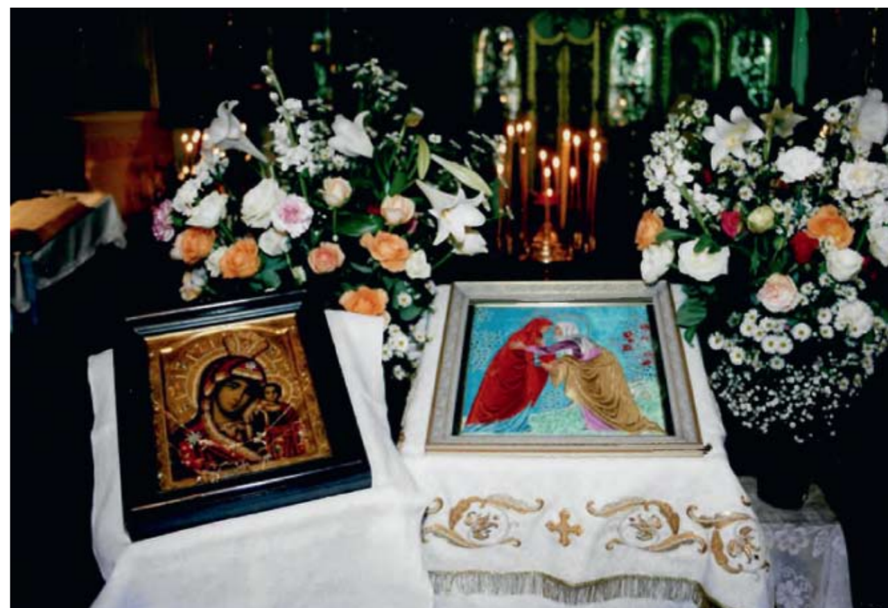
Подаренная монастырю икона