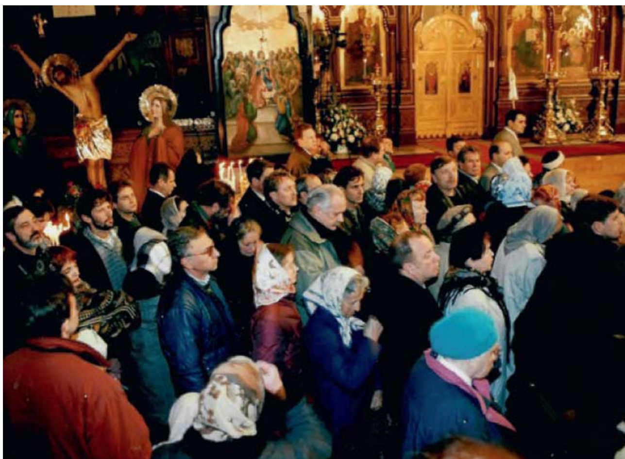
В Троицком соборе Русской Духовной Миссии. 6 января 2000 г.