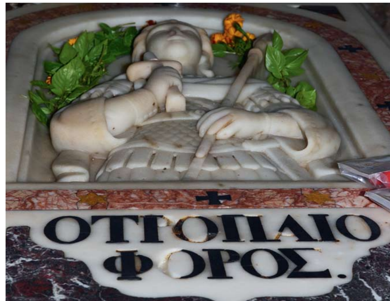
Кенотаф (надгробный памятник с пустой могилой) св. Георгия Победоносца в крипте храма св. Георгия Победоносца в г. Лидда