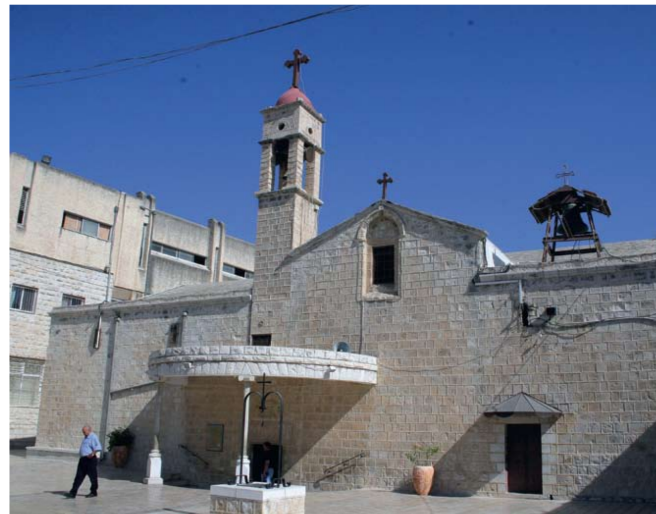
Назарет. Храм Архангела Гавриила