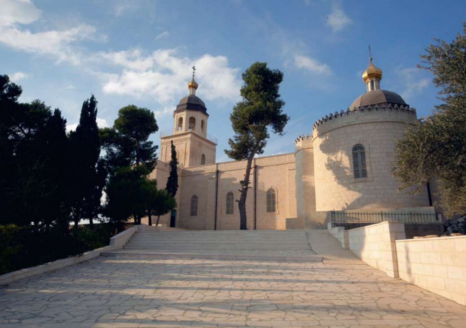
Хеврон. Монастырь Святой Троицы (Подворье в честь святых Праотцев)