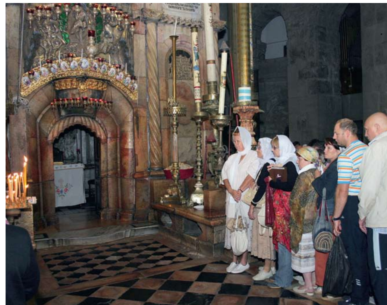
У входа в Гроб Господень