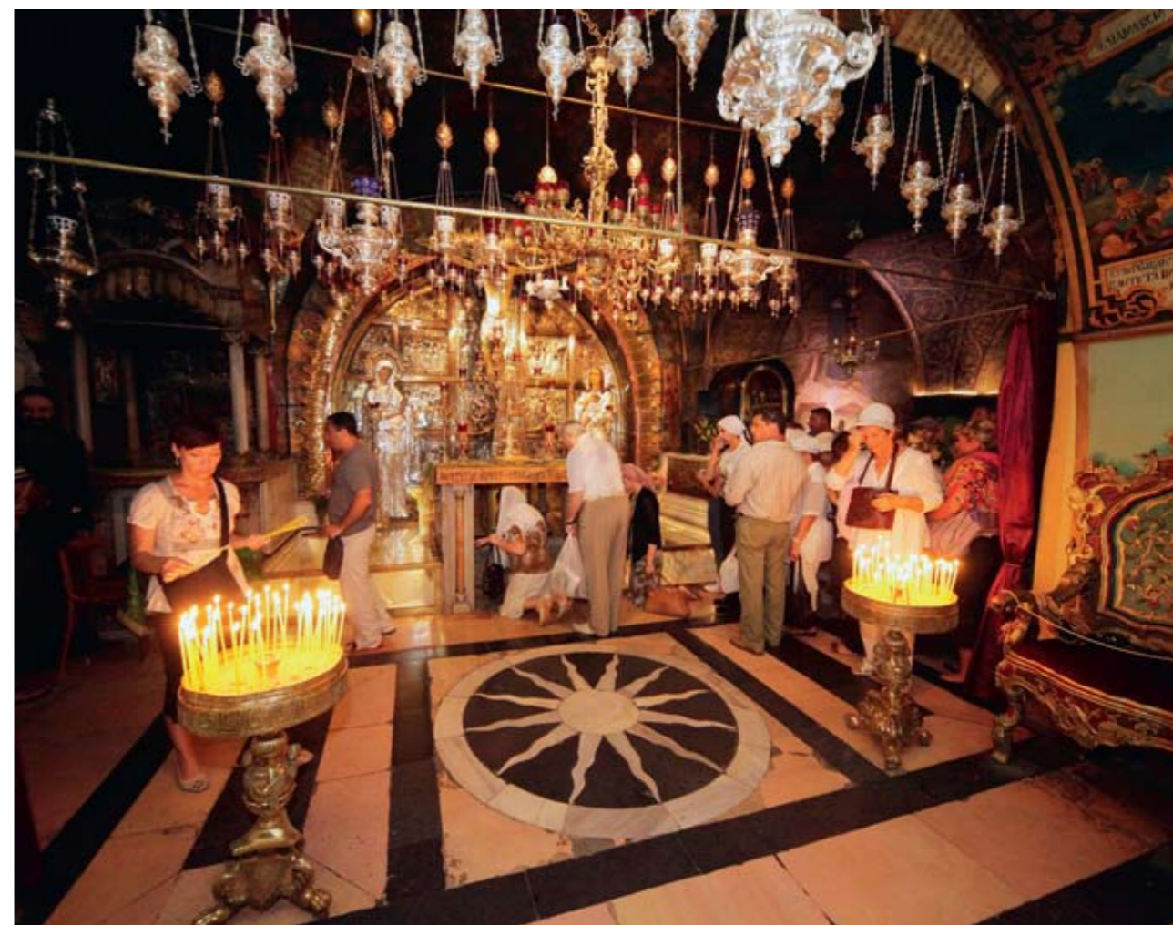
Голгофа в храме Гроба Господня