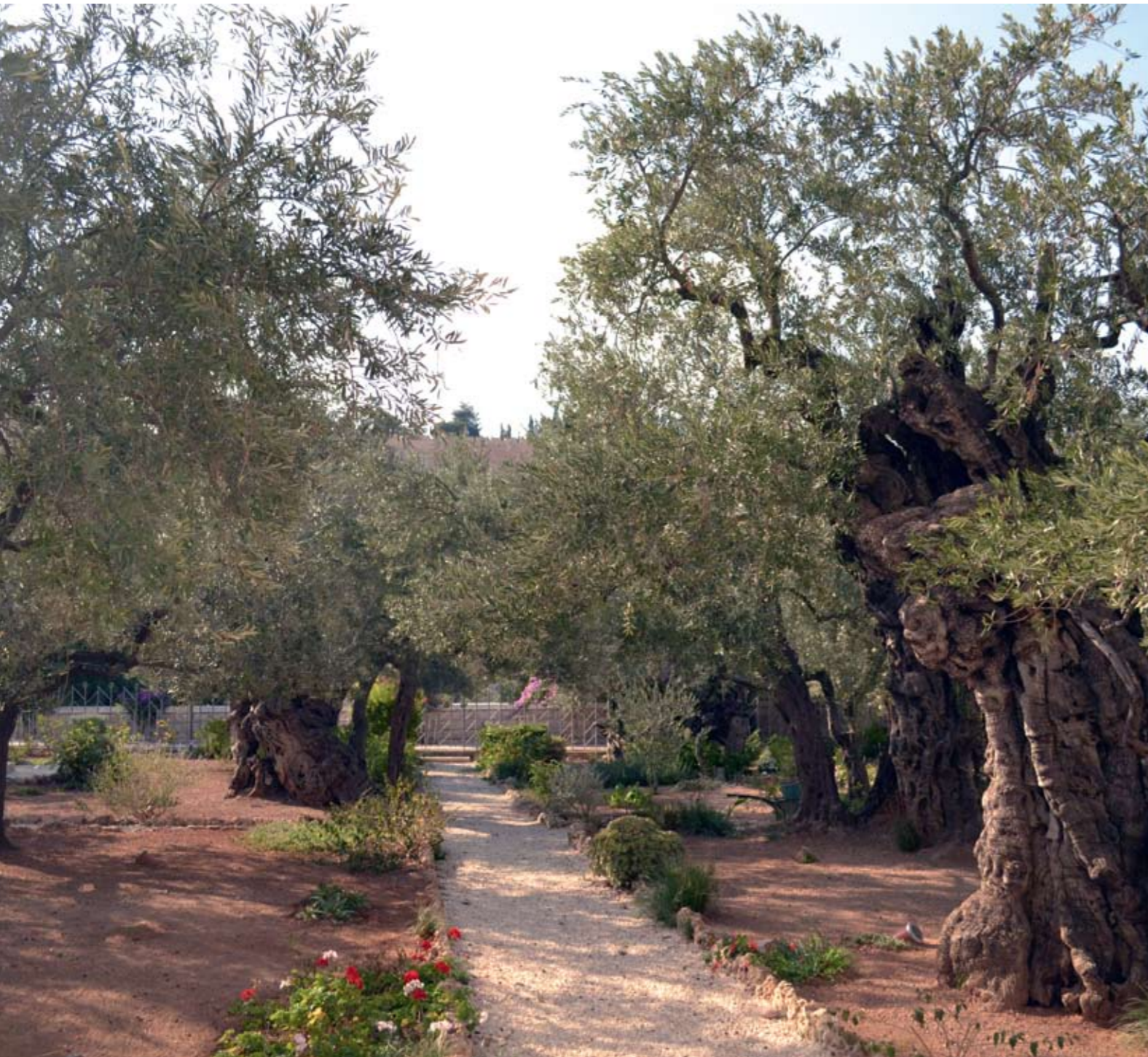
Гетсиманский сад. Старинные оливы

1. Мы, собравшиеся с Божией помощью Предстоятели, милостью Божией, Святейших Православных Церквей и совместно литургисавшие в Вифлеемском Святом Храме Рождества Господня, сегодня, 25 декабря 1999 – 7 января 2000 года, в праздник Рождества по плоти Господа и Бога и Спаса нашего Иисуса Христа, посылаем из Богоприемного Вертепа целование любви всем находящимся в мире братьям и сослужителям нашим и благословение от Бога всей полноте Единой Святой Соборной и Апостольской Православной Церкви вместе со всеми верующими во Христа людьми во всем мире. Радуйтесь всегда, братья, о Господе Боге нашем.