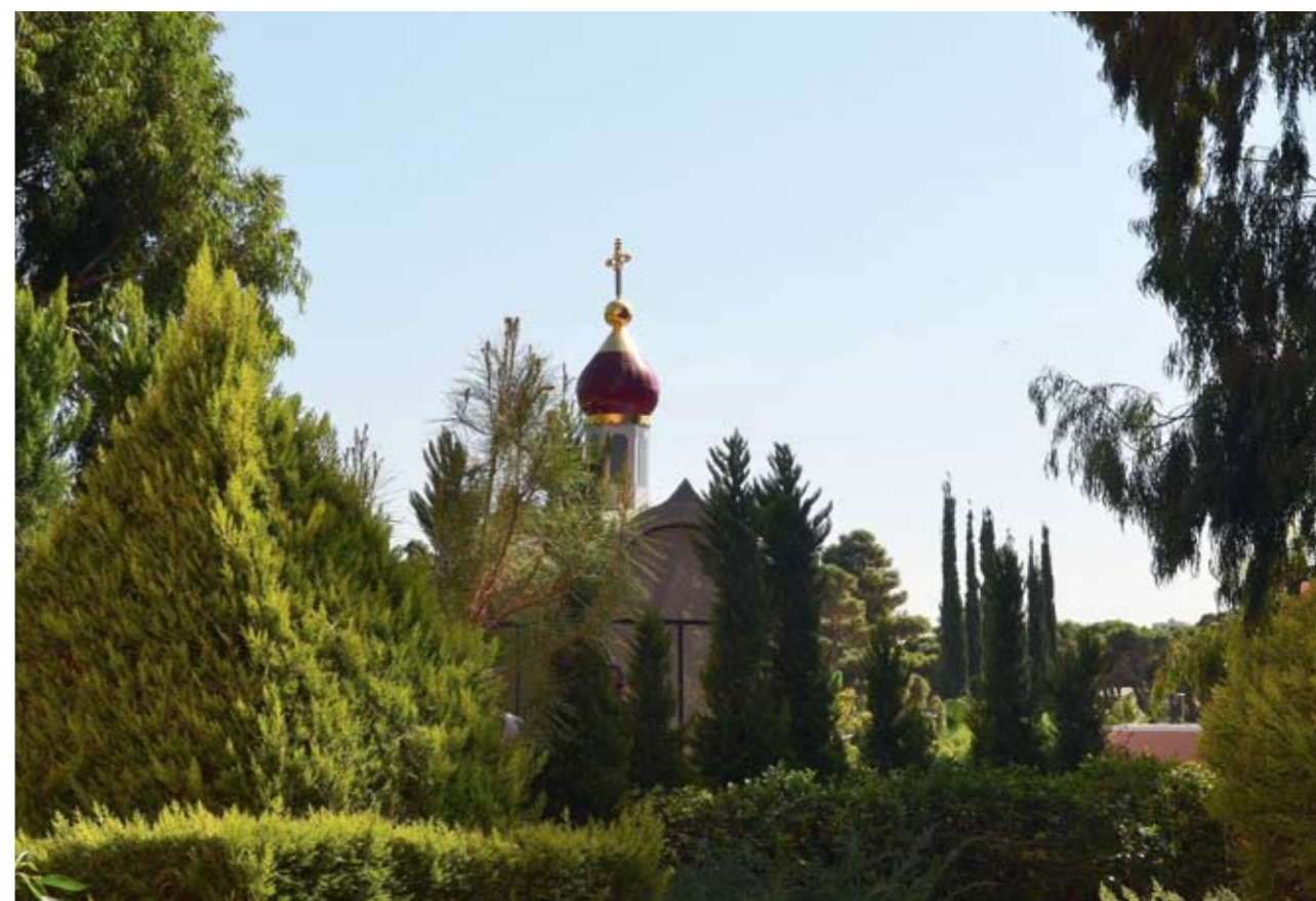
Яффа. Часовня над гробницей св. праведной Тавифы