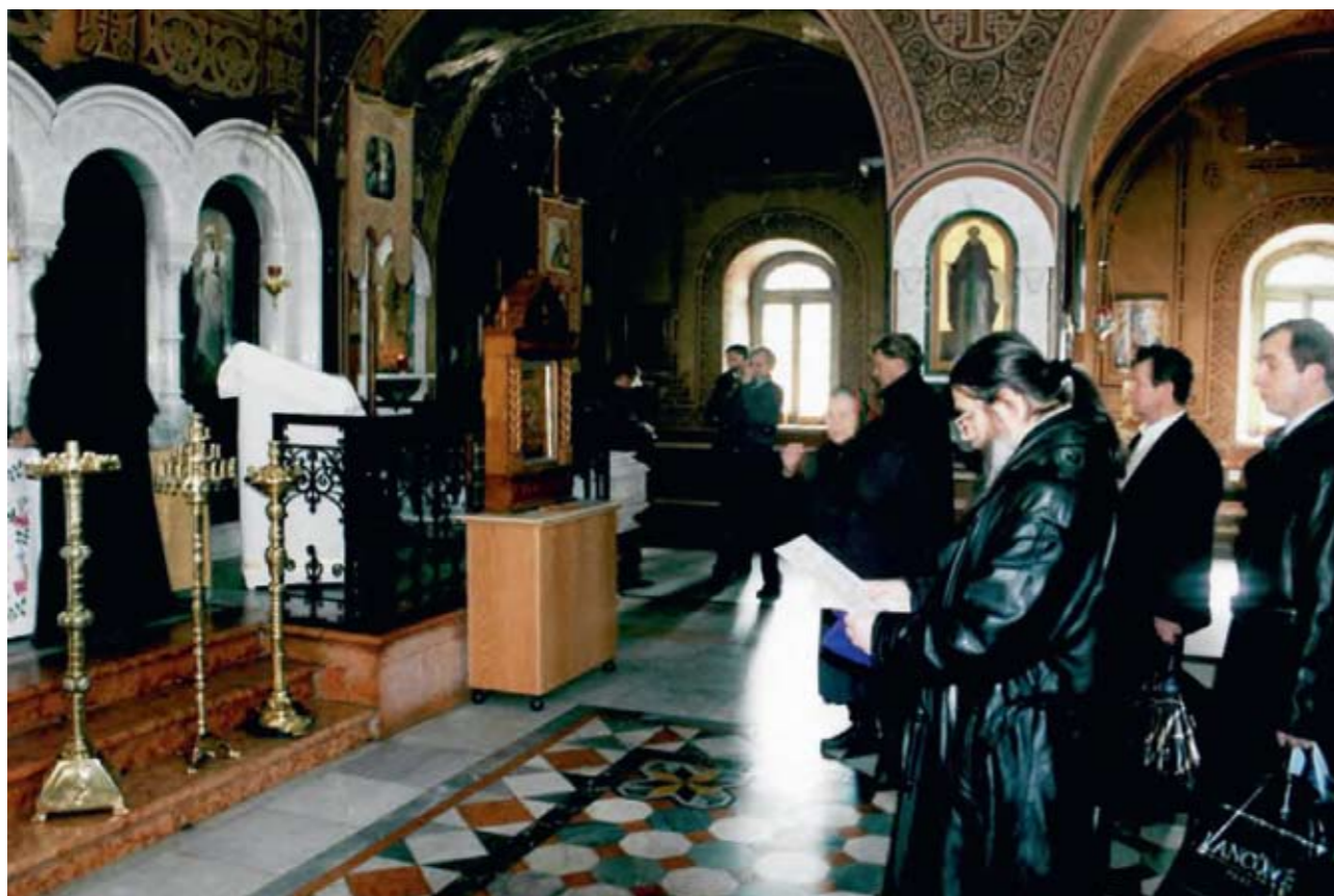
Гетсимания. В храме Марии Магдалины