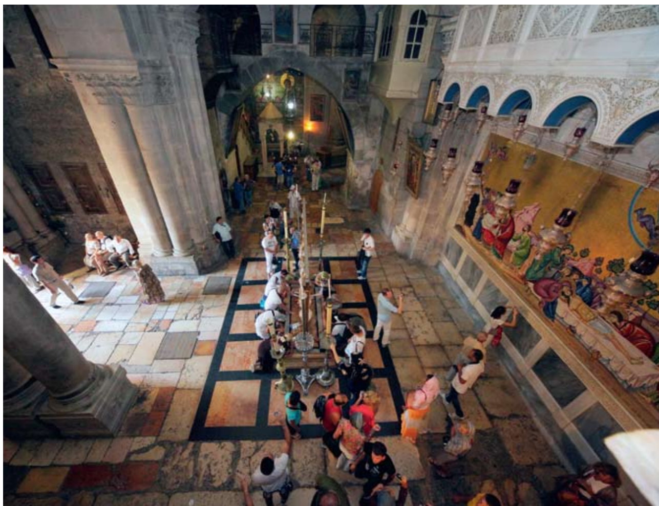
Вид на Камень Помазания в храме Гроба Господня