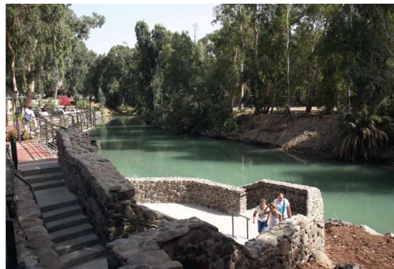
Река Иордан. Ярденит – место проведения символического обряда крещения